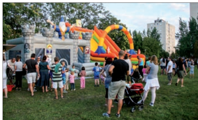
Sok család számára adott felejthetetlen élményeket a nap