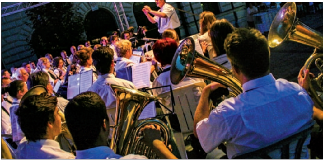
A Körös-parti Vasutas Koncert Fúvószenekar Felnőttzenekari Nívódíjat kapott

Idén immár huszonnyolcadik alkalommal rendezték meg a fúvószenekari fesztivált Békéscsabán, ezúttal augusztus 14. és 17. között. Négy ország kilenc zenekara bizonyította estéről estére, hogy a fúvószenekar több az indulóknál, hiszen a csapatok játszottak többek között musicalbetétdalokat, népszerű slágereket is.