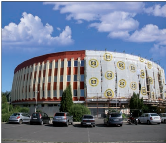
Közel 270 millió forintból újítják fel a sportcsarnokot

A gazdasági ügyekért felelős alpolgármester hozzátette: a megvalósítás nyomán a sportcsarnok fűtése önállóan működik majd, leválhat a kórházi rendszerről. A melegvízelőállítás napkollektoros rendszer hasznosításával komoly megtakarítást eredményez. A korszerűsítés eredményeként