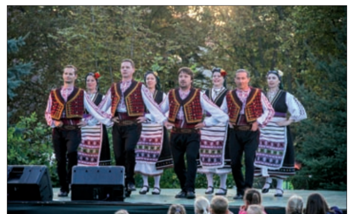
A színpadon egymást váltották a fellépők

– A programot idén is igyekeztünk úgy összeállítani,