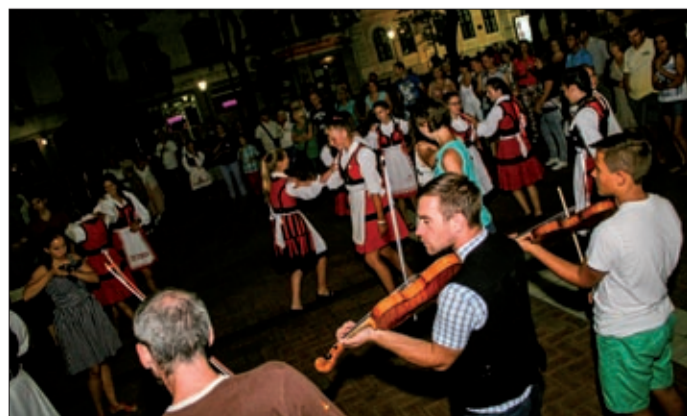
Táncművészek a főtéren a Fabatka kíséretével

A Meseház Felcsík házhoz jön programja évről évre elhozza nekünk azokat az értékeket, amelyek megcsodálásáért máskülönben több száz kilométert kellene utaz-