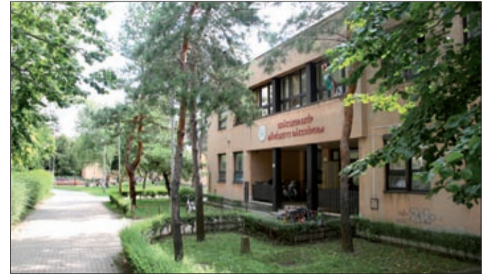
Az óvodák energetikai fejlesztése 1,27 milliárd forint értékben valósulhat meg

A TOP keretében a 12,5 milliárd forint biztosan a város rendelkezésére áll, de a tervek mintegy 18 milliárdos fejlesztésről szólnak. A kormányzat egy olyan tervezési folyamatot írt elő a keret leírásához, amelyben elvárás, hogy az összeg mintegy másfélszereséről szóljanak a tervek. Ez egyfajta biztosíték arra, hogy a nevesített összeget mindenképpen felhasználja a város. Békéscsabán több hónapos munka eredményeként születtek meg a tervek, júniusban pedig a közgyűlés elfogadta az integrált településfejlesztési stratégiát, illetve a városfejlesztési koncepciót, amelyben már szerepelnek a konkrét fejlesztési projektek. Ha a dokumentumcsomagot a kormány is elfogadja, indulhat a szükséges források lehívása. A döntést már ez év őszén meghozhatják, a beruházások várhatóan a következő évtől indulhatnak. A fejlesztések intenzitása tehát fokozódik: ebben a hétéves