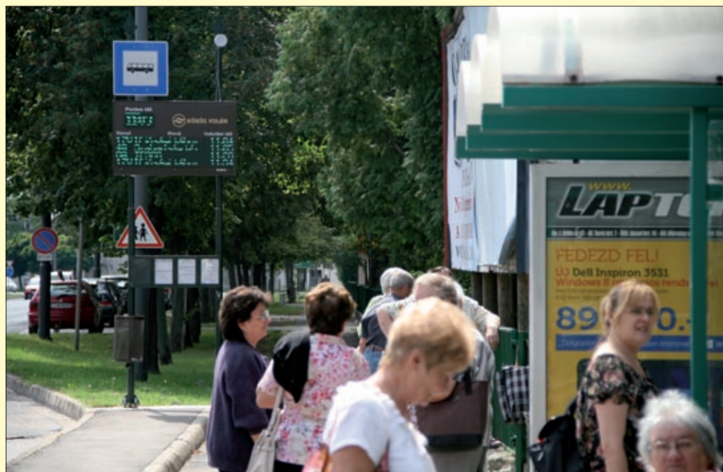
Békéscsabán hét megállóban segítik digitális kijelzők az utasokat

Integrált utastájékoztató és forgalomirányítási rendszer a Körös Volánnál