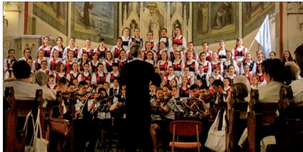
A Szentegyházi Gyermekfilharmonia a belvárosi katolikus templomban