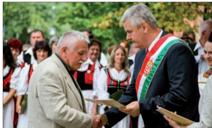
Ezúttal negyvenen tettek állampolgársági esküt