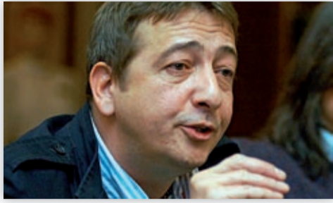
Bayer Zsolt magyar író, újságíró, publicista