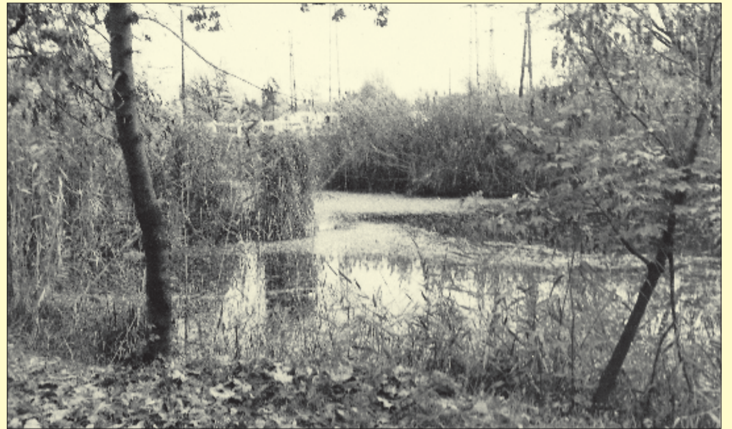
A „holtfürdőhelyről” húsz évvel ezelőtt készült a fotó

Az egykori csabai körösi fürdőhelyek közül szeptember végéig is látogatott hely volt az, amely a Békési zsilip közelében, 1904-ben létesült a villanytelepnél. Az ott kialakult öbölbe – a villanytelepi gépházból – két vastag betoncsővön folyt be a meleg víz, ahol százak fürödtek.