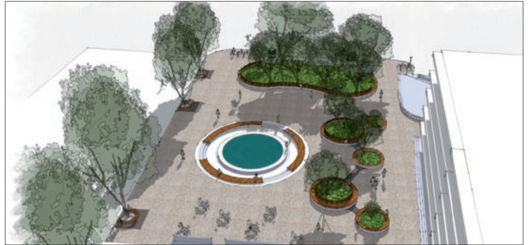
A Korzó tér látványterve: a szökőkút vízkepe is megújul majd

Mint arról már beszámoltunk, folytatódik a belváros rehabilitációja, mely a jövő év nyarára készül el. A projekt összköltsége 814 millió forint, ebből az önkormányzati fejlesztés 653,4 millió, ez 100 százalékos támogatottságú. A fejlesztésben részt vevő vállalkozók 160,6 millió forinttal járulnak hozzá a költségekhez, melyhez 74 millió saját forrást is felhasználnak.