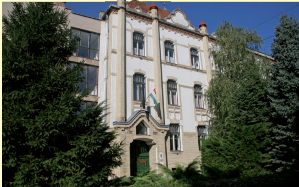
Hét év alatt közel bruttó 4,6 milliárdot fordíthat a város az intézmények fejlesztésére

A 2014–2020-as uniós költségvetési ciklusban a forráselosztás abból indul ki, hogy vannak olyan fejlesztési célok, amelyek evidensnek tekinthetők. A megyék, megyei jogú városok számára ebben az időszakban célzottan biztosítanak forrásokat a lakosság szám és a fejlettségi állapot figyelembevételével. Békéscsaba, a kormánydöntés szerint, a 2014–2020-as időszakra 12,5 milliárdot kaphat a Terü-