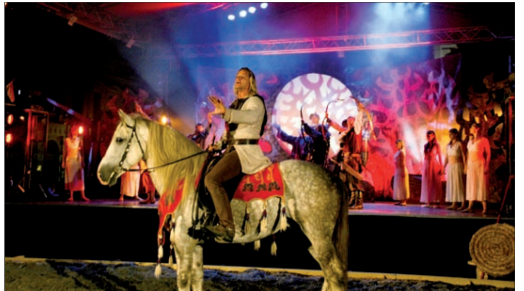
Óriási sikert aratott a Szent István téren a Honfoglalás című rockopera