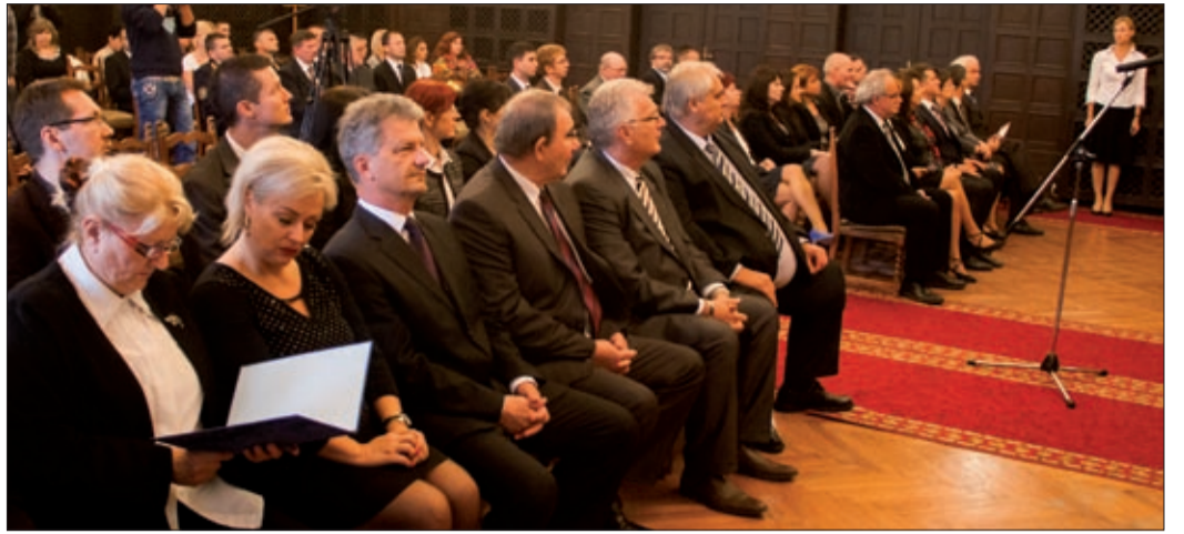
A polgármester és az egyéni képviselők október 16-án vették át mandátumukat

Megválasztották a nemzetiségek képviselőit is