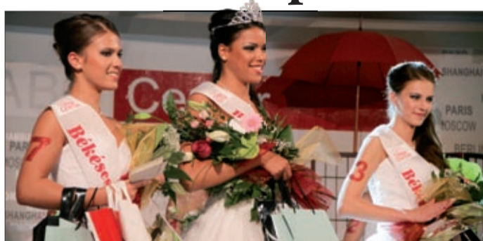
A Center divatnapokon választották meg Csaba szépeit

Oktober tizedikén és tizenegyedikén a megszokottnál is nagyobb volt a nyüzsgés a Csaba Centerben, ahol a Glamour napokhoz kapcsolódóan tartották meg az őszi divatnapokat és akciók éjszakáit. Ezúttal a divatnapok adtak keretet a Békéscsaba Szépe választásnak is.