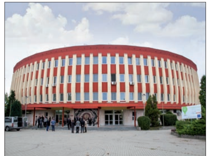
Megújult a nyolcvanas években épült csarnok

Amennyiben a Csaba Park második üteme is megvalósul, a nagy fesztiválokat már ott tartjuk, s a sportcsarnok kimondottan a sportcélakat szolgálja majd. Ezzel a fejlesztéssel is hosszú távú