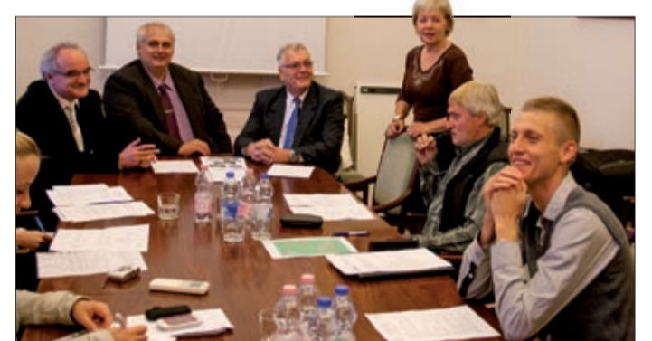
A városházán fogadták az atlétikai klub képviselőit

Mint megtudtuk, a klub júliusban a Sport XXI. Alapprogram régiós koordinátora lett, ami három pályaversenyre, 2-2 mezei és teremversenyre