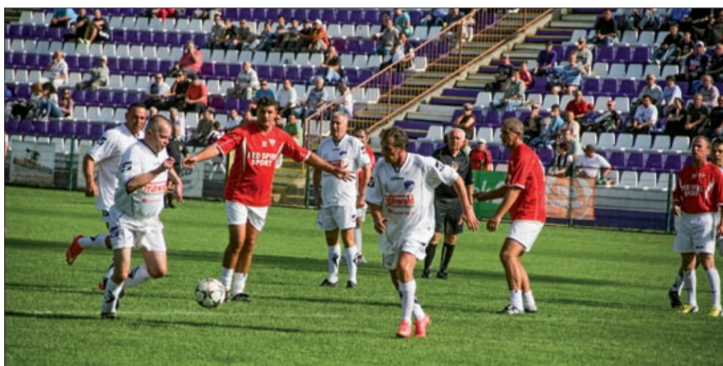
A régi csapatok ma is kicsalogatták a meccsre a szurkolókat

A 40 és a 20 évvel ezelőtti Előréti ünnepelték