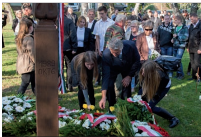
Megemlékezés az Aradi vértanúk ligetében