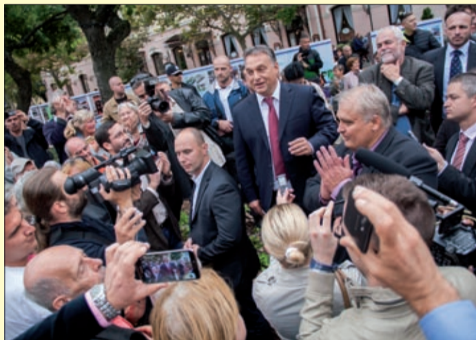
Orbán Viktor szükségesnek tartja az 44-es megépítését

Országjáró körútja egyik állomásaként, Szeged és Makó után Békéscsabára is ellátogatott október 7-én Orbán Viktor miniszterelnök.