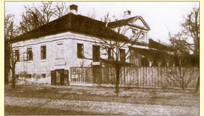
Az egykori „sörházban” gőzsobát is kialakítottak

Ezen a testületi ülésen elhatározták még, hogy a temető sarkára „sörház” is épüljön, „s az építési vállalkozás hírlapok útján is közönségesíttessék.” Eltelt néhány év, 1850-ig nem volt jelentkező a sörház felépítésére. 1850. február 8-án viszont megérkezett Berger egy kedvező ajánlattal: ha ő ingyen megkapja a telket és a „kocsmáltatási és vásári jogot”, a telken nemcsak felépíti a sörházat, hanem egy főzésre 70 akó (1 akó 53-40 liter) és 15 akó 30°-os pálinkát készít, amit a ház pincéjében lévő vendéglőben szolgál fel. És ugyanitt – mert akkor még nem volt Csabán – hat-szobás gőzfürdő létesítését is