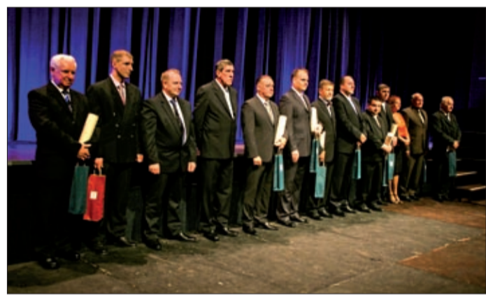
Díjazták a kiváló mestereket és vállalkozókat