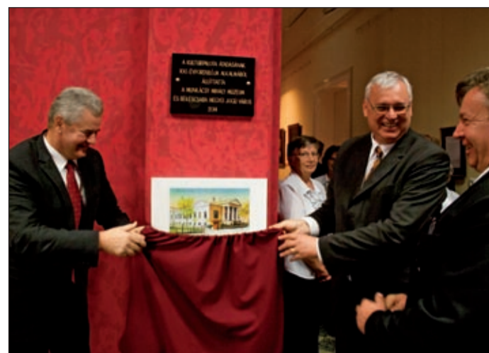
A százéves épület tiszteletére emléktáblát lepleztek le

Ando György igazgató történeti áttekintésében elmondta, hogy a Varságh Béla gyógyszerár-tulajdonos által 1899. július elsejére összehívott értekezleten határozták el a „város társadalmának vezetői” a múzeumi egyesület létrehozását. Tervükhöz tekintélyes pártfogóra leltek Zsilinszky Mihály vallás- és közoktatásügyi minisztériumi államtitkár személyében. Áchim L. András akkor elnevezte a múzeum létrejöttét, mondván, hogy „ha az uraknak kell múzeum, építsék fel maguknak!” A lokálpatrióta, a kultúra értékei iránt érzékeny csabaiak azonban mégis megépítették ezt a csodá-