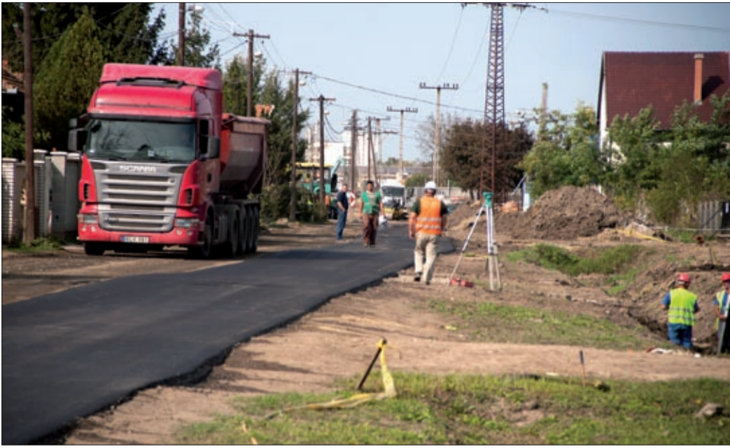
A jelenlegi beavatkozás csak ideiglenes megoldás a Gyár utcában

Elkészült a Gyár utca ideiglenes, új burkolata. A megnövekedett forgalmú, jaminai útszakaszon eltűntek a jókora kátyúk, így már jobb körülmények között közlekedhetünk.