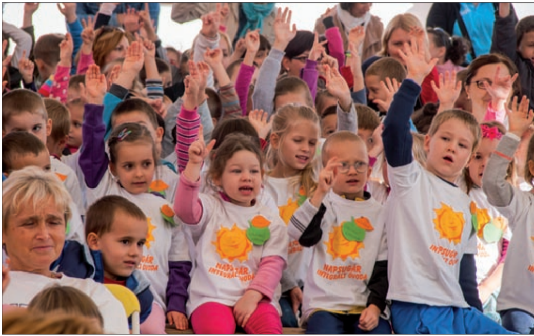
Mintegy 470 nagycsoportos óvodás vett részt a CsabaParkban az almafesztiválon