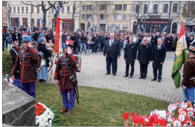
A polgármester és az alpolgármesterek is koszorúztak

A huszárokkal, lovakkal szekerekkel, táncosokkal felvonuló díszmenet a főtéren ezúttal is látványos attrakciója, méltó nyitánya volt az ünnepnek. A Szent István téren a katonai tiszteletadással kísért