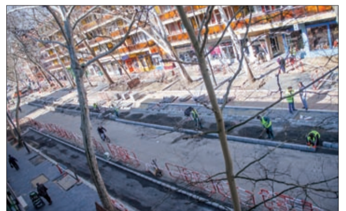
Folyamatosan dolgoznak az Andrassy úton

Aktuális munkák a Mednyánszky utcán és a Korzó téren: A kivitelezők elkészíteték az Andrassy út torkolatától a Csaba utca irányába a Mednyánszky utca páros oldalán lévő járdát, amit ismét haszná-