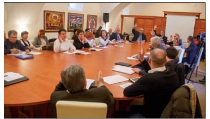
Halaszthatatlan ügyekben hozott döntést a testület

A következőkben kerékpárúthálózat-fejlesztési pályázaton történő indulásról határozott a testület. Mint megtudtuk, az Új Széchenyi Terv Közlekedésfejlesztési Programjának keretében jó eséllyel indulhat városunk támogatásért olyan projektekkkel, melyek már rendelkeznek engedélyes tervekkel. A támogatás mértéke 100 százalékos, az igényelhető támogatás legmagasabb összege bruttó 200 millió forint lehet. A megadott feltételeknek két útszakasz felel meg. Az egyik a Szarvasi út mentén, a Ká-