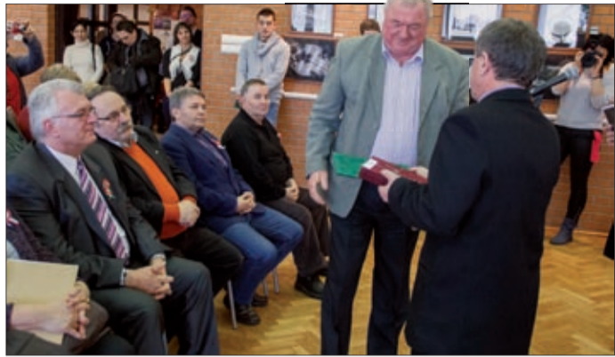
Idén 91-en neveztek összesen 419 fotóval

Ötven fotót láthat a közönség a Csak tiszta forrásból című pályázatra beérkezett művekből rendezett kiállításon, a Lencsési Községi Házban. A tárlatot március 14-én délután nyitották meg.