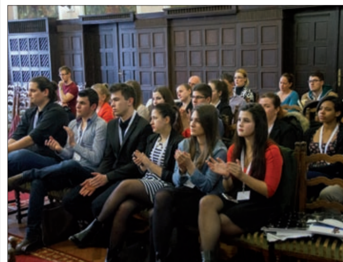
A városvezetés változatlanul számít a fiatalokra, fontosnak tartja az ifjúságot érintő ügyeket

A város ifjúsági koncepciója megújul, s ennek a munkának az első állomása a március 11-én, a városháza dísztermében megrendezett találkozó volt, melyen bemutatták a munkacsoportokat és vázolták a feladatokat is.