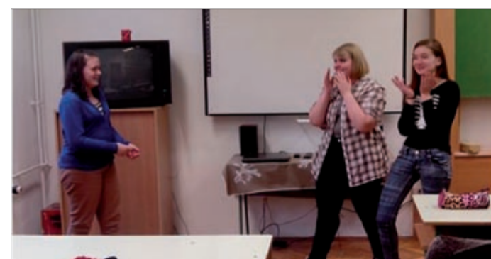
A tanulók két éven át havi egy foglalkozáson vesznek részt

Mint megtudtuk, a jelentkező tanulók két tanéven keresztül, havi egy-egy foglalkozáson vesznek részt. Az első tanévben az „irodalom határterületeire” kalauzolják el őket. Közös olvasnak kri-