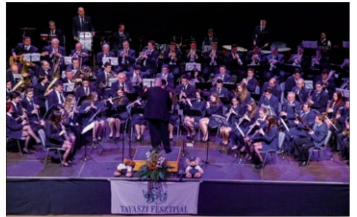
A Körösparti Vasutas Koncert Fúvószenekar a megnyitón

A Körösparti Vasutas Koncert Fúvószenekar koncertjével vette kezdetét március második hétfőjén a XII. Békéscsabai Tavaszi Fesztivál, amelynek keretében harminc napon át mintegy hatvan program várja a kultúra barátait Békéscsabán. Az eseményt a Csabagyöngye Agóra termében Szarvas Péter polgármester nyitotta meg.