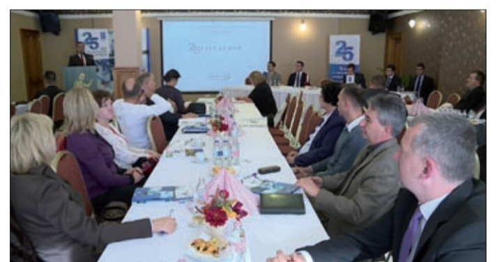
A mikro-, kis- és középvállalkozások fejlődését segítik

A konferencián az is elhangzott, hogy a 2014–2020-as uniós ciklusban mintegy