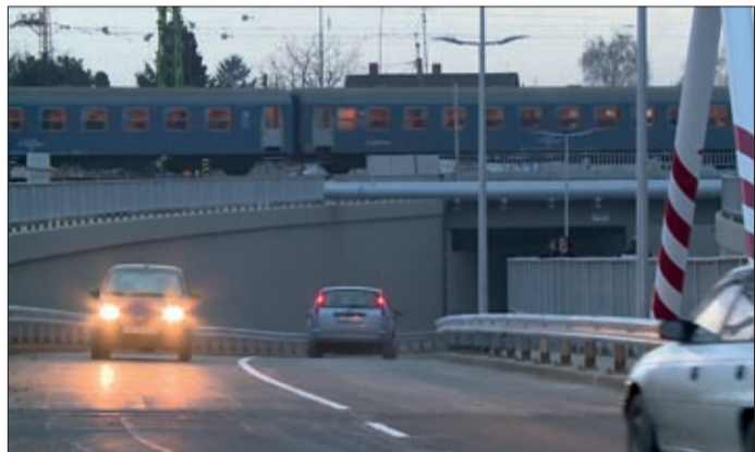
A Szerdahelyi utcai aluljárót az autók előtt is megnyitották

tér gyors ütemben készül, az épület használatbavételének időpontjára az egész terület elnyeri végső képét, de a végleges burkolat egy része csak jövőre készül el. Az új parkolót már használhatják az autóval érkezők.