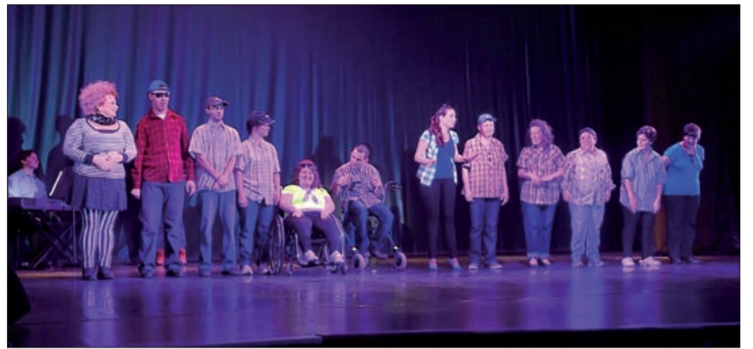
A Degré utcai gyermekotthon színészpalántái nagy sikert arattak

Újra szárnyaltak az angyalok a Jókai színházban