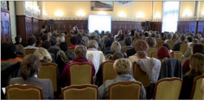
Jövőre a megyében 656 pedagógus esik át minősítésen

Az Oktatási Hivatal az ország valamennyi megyéjében konferencián tájékoztatja a pedagógusokat az életpályamodellhez kapcsolódó aktuális jogszabályi hátterekről, a tapasztalatokról és megoldási lehetőségekről.