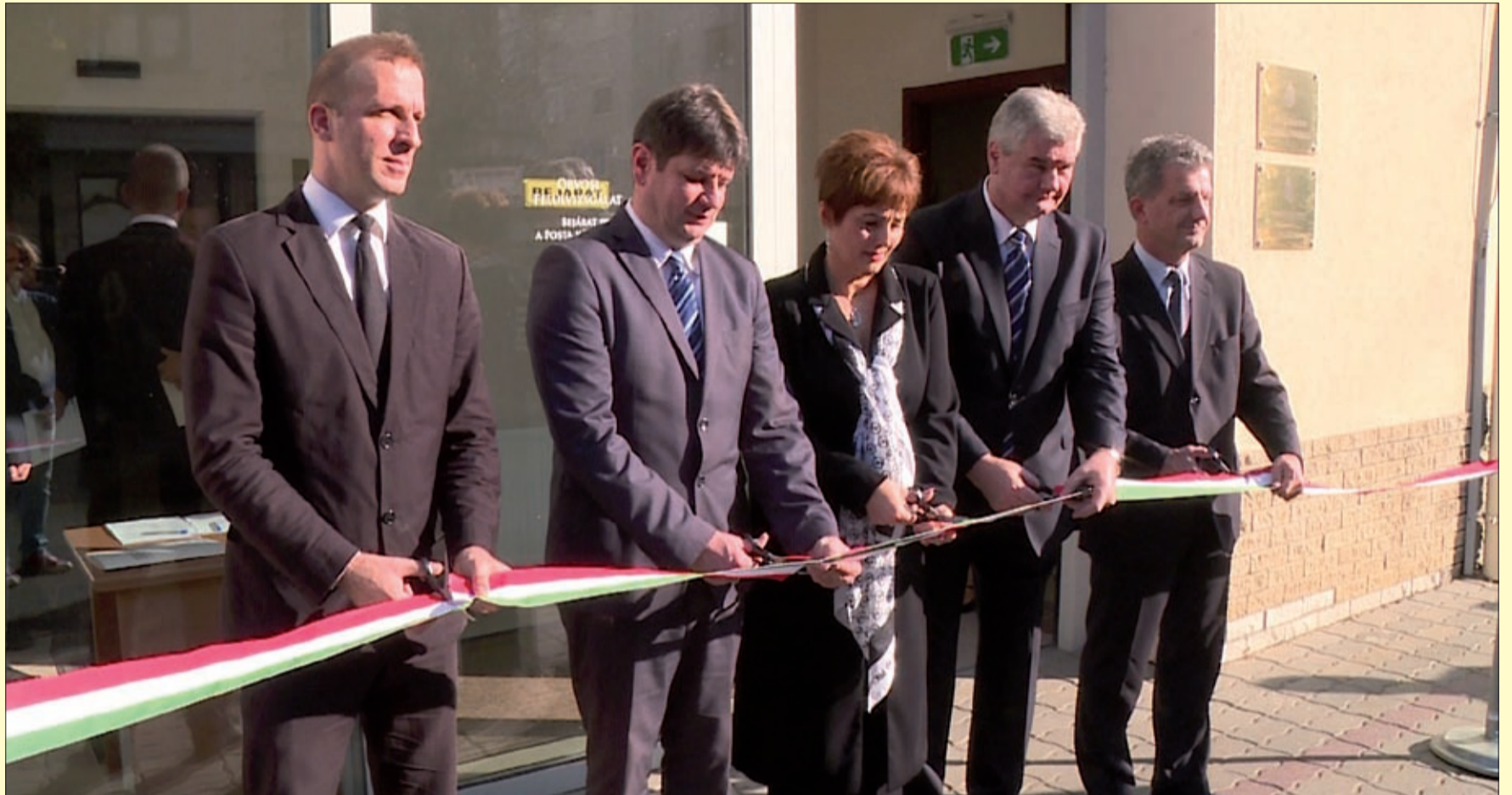
Az épület átalakított belső terekkel és új külsővel fogadja az ügyfeleket

– Az egész épületet oly módon laktuk be, hogy egymásra épülő, egymással szoros összefüggésben lévő munkafolyamatokat szerveztünk, duplikált feladatokat szedtünk ki a folyamatból, gyorsítottuk az eljárást, komplexebbé tettük, és azt gondolom, hogy az ügyfelek kiszolgálása ezen a helyen sokkal magasabb színvona-