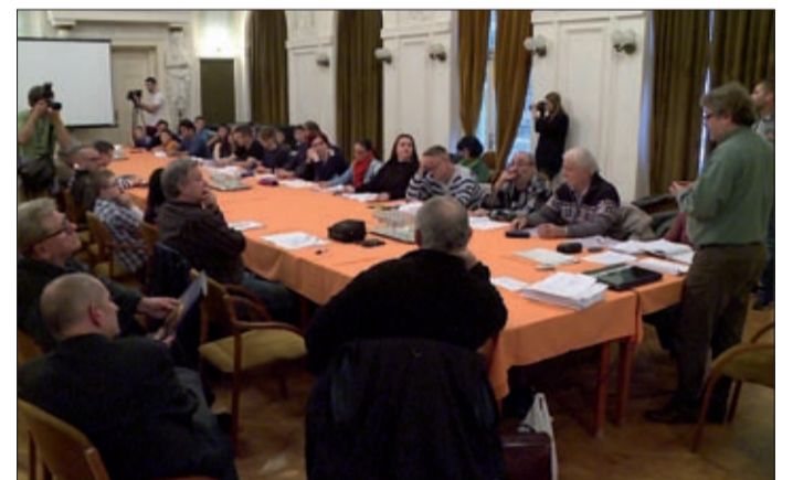
A darabot januárban mutatják be a színházban