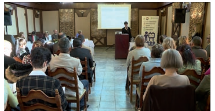
A cél a hátrányos helyzetűek felzárkóztatása volt

Hazánkban a munkaképes korúak közül mintegy 2 millióan legfeljebb általános iskolai végzettséggel rendelkeznek. Ezen számok megváltoztatásán dolgoztak az „Aktívan a tudásért!” projekt résztvevői. A 2013-ban indult program keretében, mintegy 300 településen, összesen 16 000 fő kapott esélyt a fejlődésre, ebből közel 1200-an Békés megyében végezheték el sikeresen a képzést.