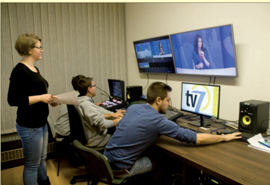
November 20-ától sugározza műsorát a 7.Tv csatorna

Békéscsaba közgyűlése március 26-án döntött arról, hogy a megyeszékhely önkormányzata hozza létre a százszázalékosan tulajdonában álló Békéscsabai Médiacentrum Kft.-t. Októbertől már a Békéscsabai Médiacentrum Kft. adja ki a Csabai Mérleg című ingyenes városi lapot. November 16-án indult el hírportálunk, a www.behir.hu, amelynek tartalmát a facebook oldalunkon is követhetik. November 20-ától pedig a harmadik elem is a helyére került: megkezdte sugárzását a 7.Tv nevű tévécsatorna.