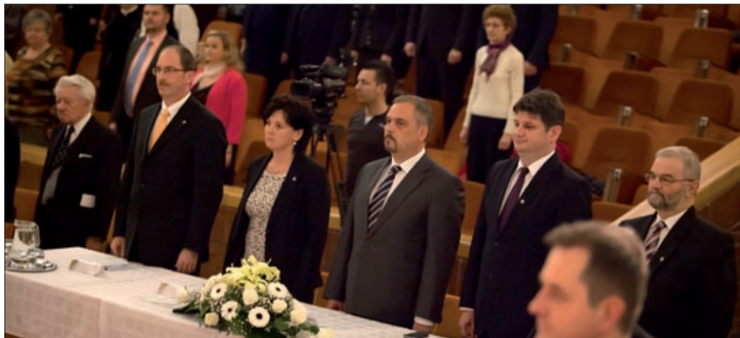
Ünnepi üléssel, emléktábla-avatással és kiállítással is emlékeztek