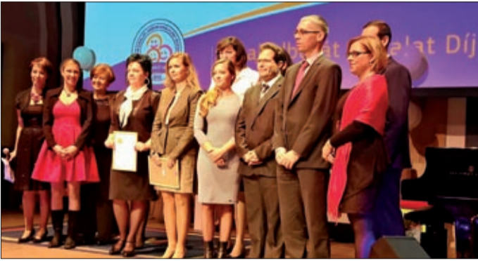
Az egyesület nonprofit szervezetként kapott elismerést