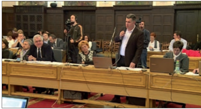
A feladatok végrehajtása megfelelő ütemben halad

A képviselő-testület megtárgyalta az idei költségvetés első háromnegyed éves teljesítéséről szóló beszámolót. A számokból megállapítható, hogy a költségvetési rendletben tervezett feladatok végrehajtása az év első kilenc hónapjában megfelelő ütemben haladt.