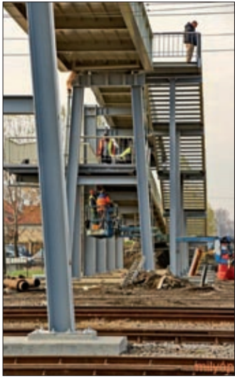
A repülőhíd átadására várni kell

Az vasútállomás épületét a tervek szerint karácsony előtt vehetik birtokba az utasok. Az állomás előtti