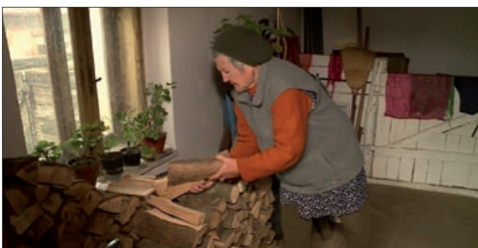
Jól jön a segítség a téli időszakban