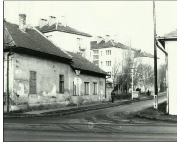
A fotó ötven éve, közeli lebontása előtt örökítette meg az öreg házat a Dózsa György út–Vilim utca sarkán

Wilim János evangélikus tanító szegény földműves szülők gyermekeként látta meg a napvilágot (1800. január 19.) a Turóc megyei Bisztricskán (Turócszenterce). Felsőbb tanulmányait Lócsén és Eperjesen végezte, innen került 1821-ben Nagykárolyba tanítónak. Itt tanult meg tökéletesen magyarul, és vette kezdetét magasra ívelő tanítói pályája. 1825-től 17 évig mezőberényi tanító volt. 1842-ben az akkor megnyílt „kastélyi iskola” tanítójává választotta