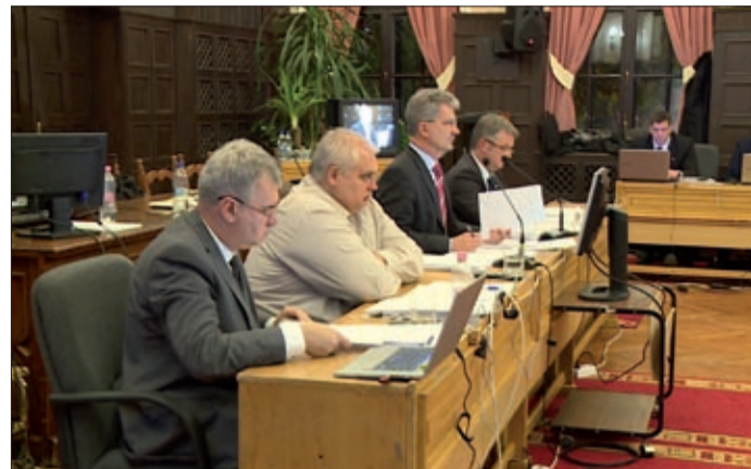
A kistérség ügyéről már többször tárgyalt a testület