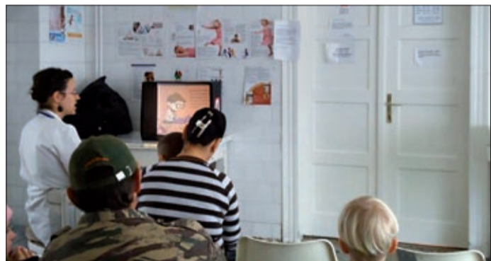
A gyerekeket és a szülőket meglepte az ötlet

November a Diafilmgyártó Kft. által kikiáltott nagy dia hónap volt, melyhez csatlakozott a Békés Megyei Könyvtár Gyermekkönyvtára is. Erre, és Semmelweis Ignác halálának 150. évfordulójára kívánták felhívni a figyelmet flashmobjukkal azok a gyermekkönyvtárosok, akik november 18-án diafilmekkel érkeztek a város gyermekorvosi rendelőinek várótermébe.