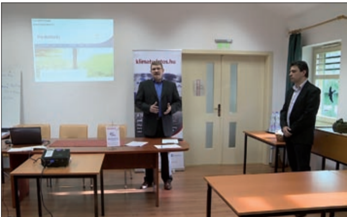
Meg kell tenni a lépéseket a környezetkímélőbb élethez

Magyarországon is egyre égetőbb kérdés a klímaváltozás, amelyre az elmúlt évek szélsőséges időjárása a bizonyíték. Éppen ezért elengedhetetlen megtenni a szükséges lépéseket a környezetkímélőbb élet felé. Ezzel a szándékkal indították útjára Békés megyében is a klímareferens szakemberek képzését, akik képesek lesznek hatást gyakorolni környezetükre az itt megismert tudás átadásával.