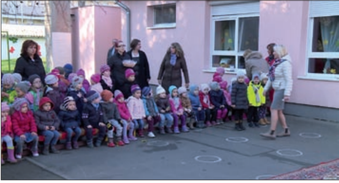
A gyerekek műsorral és ajándékkal készültek az átadóra

A Penza Lakótelepi Óvoda indult és nyert a Trilak pályázatán, amelynek köszönhetően megtörtént az épület külső szigetelése és nemes vakolattal történő burkolása. A beruházás hivatalos átadása november 18-án volt.