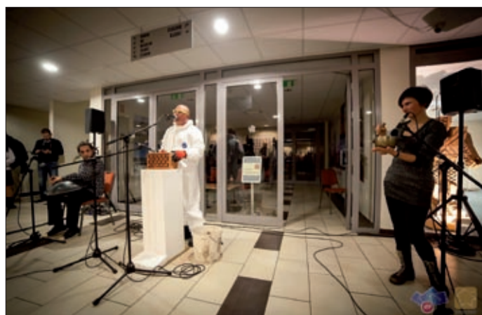
BMZ kiállításának a megnyitója is különleges volt