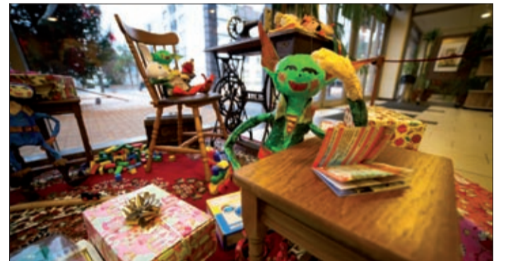
A manó az információs pulttal szemben várja a dobozokat

Idén is meghirdette önálló cipősdoboz-akcióját a Csabagyöngye Kulturális Központ: az intézmény információs pultjával szemben manók várják a nehéz élethelyzetben élők számára felajánlott ruhákat és játékokat.