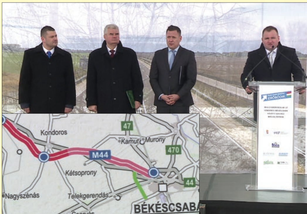
A Békéscsaba–Kondoros szakasz első ütemének 2019 végére kell elkészülnie

Történelmi pillanatnak nevezte a Nemzeti Fejlesztési Minisztérium közlekedési hatósági ügyekért felelős helyettes államtitkára az M44-es gyorsforgalmi út Kondoros–Békéscsaba közötti szakaszának kivitelezését elindító ünnepséget. A gyorsforgalmi út kiépítését, a hazai úthálózat bővítését kiemelt beruházásként kezeli a kormány – hangsúlyozta Tóth Andor Nándor.