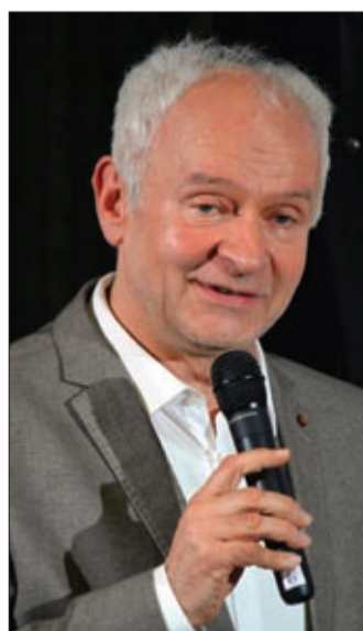
„Tartalmas öt hét volt”

A Tavaszi Fesztivál keretében tucatnyi helyszínen voltak rendezvények a kulturális területen működő intézmények és civil szervezetek közreműködésével. Ahogy Herczeg Tamás fogalmazott: élményekkel teli és igazán tartalmas volt ez az öt hét.