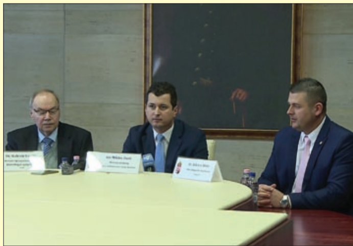
A vízzel Magyarországnak is jól kell sáfárkodnia

A legfontosabb elem, a víz nélkül nem létezne élet a Földön. Az emberi test számára nélkülözhetetlen, használjuk például öntözésre, gyógyászatra vagy közlekedésre is. A víz világnapjára a Békés Megyei Kormányhivatal konferenciát és kiállítást szervezett, ahol az öntözéshez kapcsolódó nagy projektekről is hallhattak az érdeklődők.