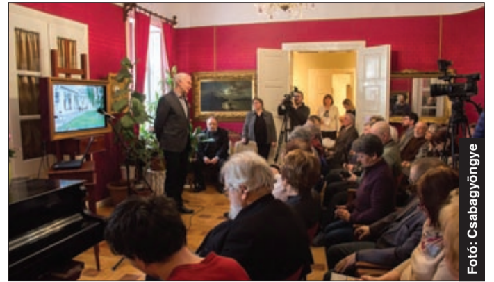
Az érdeklődők szakmai előadásokon is részt vettek

– 2002-ben rendezték meg először ezt a találkozót, amelynek menete azóta is hasonló. Az egyik nap előadások vannak, ahol a megmentett vagy megmentésre váró műemlékekről, bennük lakott egykori emberekről és az ő életmódjukról esik szó.