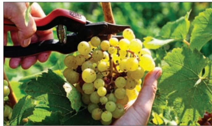
A termésből több békéscsabai intézmény is kapott

A szőlőültetvény telepítése óta 2017 volt az első olyan év, amikor az itt termelt szőlő egy részéből 280 liter palackozott, zárjeggyel ellátott pálinka készült, de a 8,5 tonnás gyümölcsstermésből a városban működő gyermek- és idősellátó intézménybe is szállítottak, így azt az ellátórendszerben lévő gyermekek és idősek is fogyasztották. Emellett egy helyi zöldséggyümölcs kereskedéssel foglalkozó vállalkozás is vásárolt a termésből. Az ültetvényről