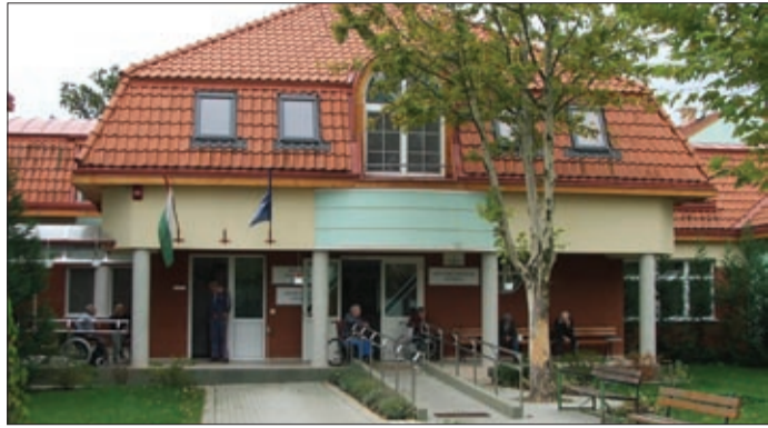
Az Ady Endre utcai otthonban sem változott a térítési díj

Nem emelkednek a díjak az önkormányzat által működtetett szociális intézményekben 2018-ban.