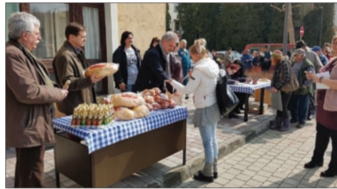
A Hajrá Csabaiak Egyesület száz családnak segített