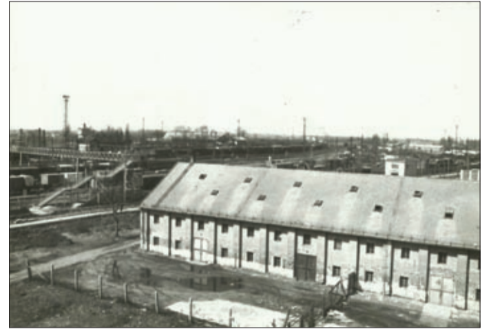
Az egykori dohánybeváltó a repülőhíddal

A vasút melletti Ör és Ihász utca között elterülő, akkoriban üres 37 260 m 2 területen jelölte ki annak helyét Milyó Mihály bíró és tanácsulése a lakosság által termelt dohány felvásárlására és dohánybeváltó létesítésére. A dohánylerakó mellé dohánybeváltó hivatalt kellett állítani, ezért 1852-ben fából megépítették az első, 42 x 15 méteres dohánytároló raktárépületet. Mire szervezetileg minden rendben lett, 1858-at írtak. Így Nagy Antal bíró idejére esett a dohánybeváltó alapításának éve. Ekkor csupán 15 dolgozót alkalmaztak. Az 1857. évi lakossági összeírás szerint egyébként Csabának akkor 26 705 lakosa volt.