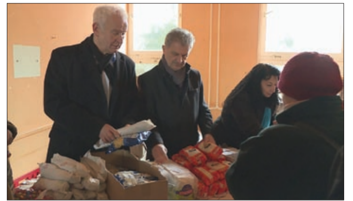
Az önkormányzat háromszáz családnak osztott ételt