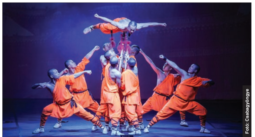
Kínai shaolin mesterek és tanítványaik lélegzetelállítóan izgalmas bemutatója