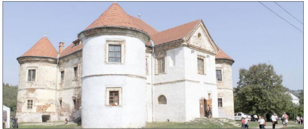
A magyarózdai Radák-Pekry kastély

Békéscsaba régebbi történelmének egyes szálai Erdély felé vezetnek. A 19. század második felében még az erdélyi Magyarózd adott otthont olyan okleveleknek, melyek a csabai helytörténet értékes forrásai. Miről szólnak ezek az oklevelek és miként kerültek a távoli Erdélybe? Érdemes megemlékeznünk minderről a nemzeti összetartozás napja alkalmából.