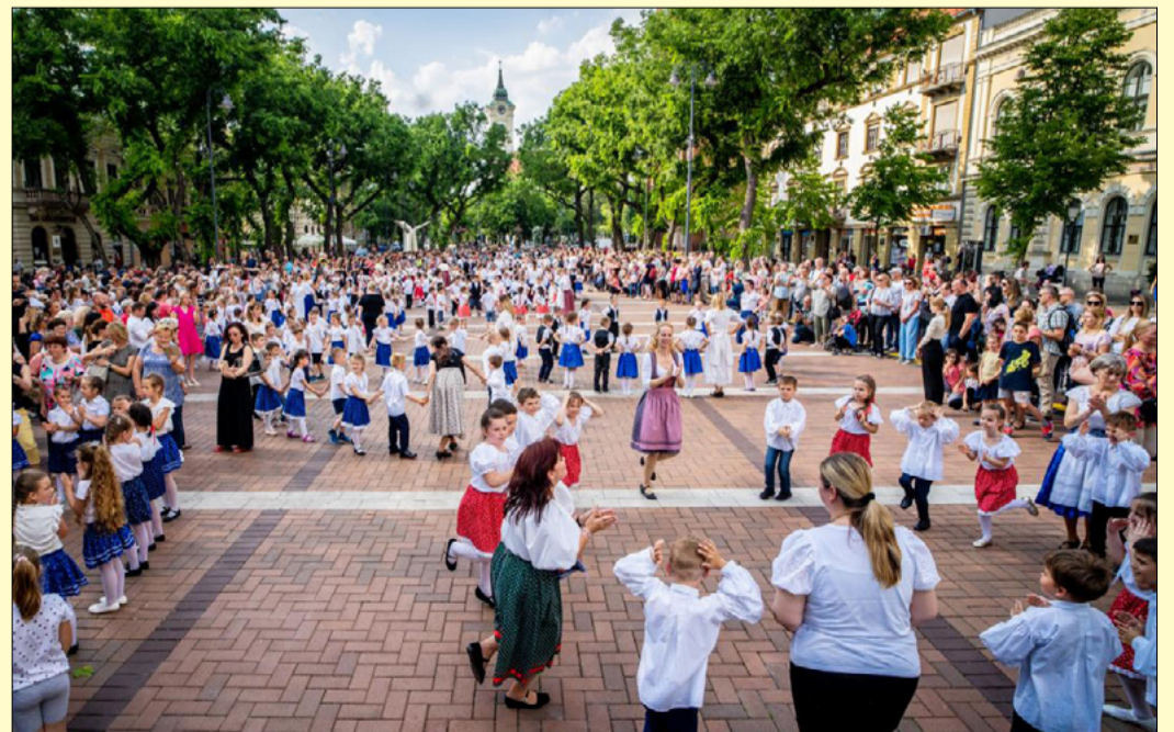
Több mint négyszáz nagycsoportos ropta a táncot a város szívében