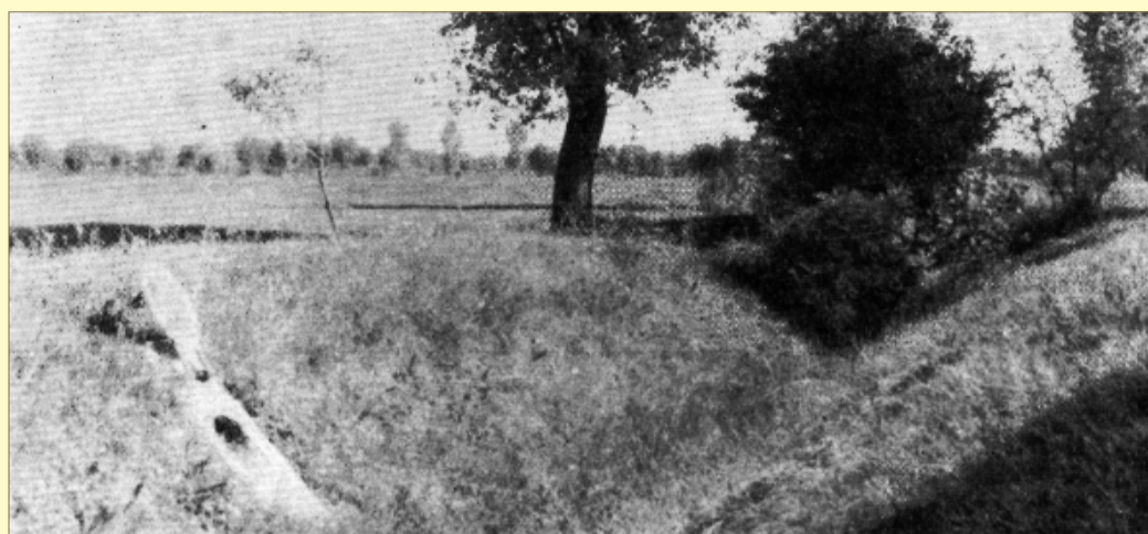
Az öntözött rét főcsatornája – egykor országosan is sikeres volt az öntözőtelep

Darányi Ignác földművelésügyi miniszter Csaba községnek, 1900 tavaszán, a szikes Borjúrétten – 177 katasztrális holdon – legelő-öntözésre államsegélyt biztosított. A terveket az aradi kultúrmérnökség készítette.