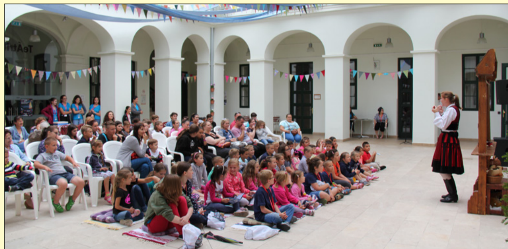
Utoljára négy éve volt bábfesztivál, most június 22-26-ig tart majd