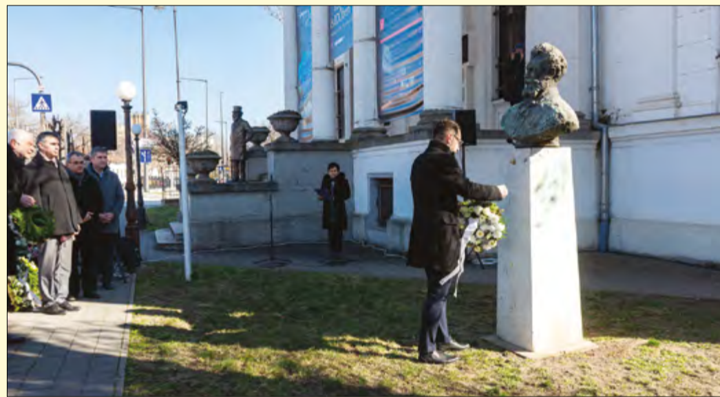
Megemlékezés és koszorúzás a múzeum kertjében található szobornál