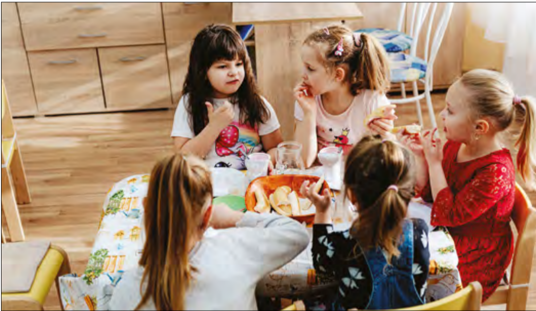
Hetente egyszer tejet, két alkalommal gyümölcsdarabos joghurtot kapnak az ovisok