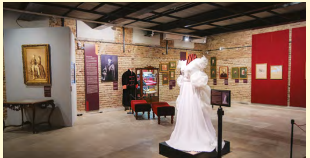
A tárlat különlegessége egy Munkácsy Mihály ihlette menyasszonyi ruha

Olyan komoly tudásbázis van birtokunkban a páratlan relikviagyűjteményen túl Békéscsabán, a Munkácsy