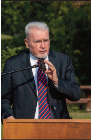
Pálincás József az MTA volt elnökének ünnepi beszéde