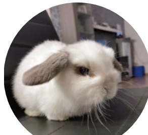
Hope – 29 szavazat