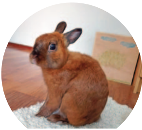
Olivér I. – 171 szavazat

Szigethalomért Egyesület oldalán lehetett leadni a voksokat egy like gomb megnyomásával, március 24-ig.