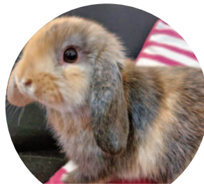
Maya II. – 142 szavazat