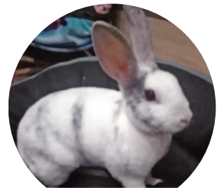
Bogyó III. – 123 szavazat