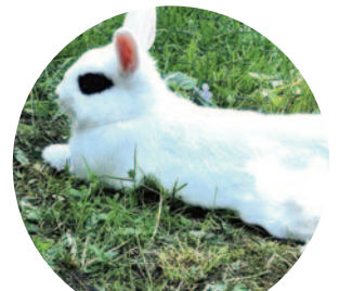
Bogyó 2 – 35 szavazat