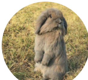
Zsömi – 76 szavazat