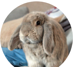
Szimba – 105 szavazat