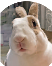
Málna – 34 szavazat