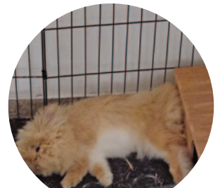
Flufi – 27 szavazat

Minden gazdinak nagyon köszönjük, hogy benevezte kis kedvencét. Minden nyuszi nagyon kedves és bájos, gratulál-