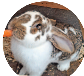
Tapsi – 28 szavazat