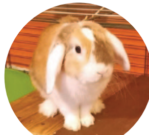
Acélfog – 52 szavazat