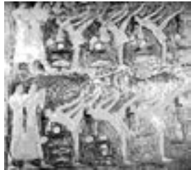
1. kép: Táncosnők. Relief a sakkari sírban 35

tiszteletére . Nem véletlen, hogy a Krisztus előtti 3500-tól 2650-ig uralkodó I-VII. dinasztia, 32 vagyis a masztabák és piramisok építésének korában kizárólag sírokban található táncra vonatkozó megőrkítések. Ezek a megőrkítések már fejlett táncművészetről számolnak be és azt bizonyítják, 33 hogy az emberi test engedelmes eszközévé lett a léleknek és a 34 tánc azoknak a komoly, sőt komor érzéseknek szimbólumává vált, amelyek eltöltik a túlvilágra gondoló emberi lelket.