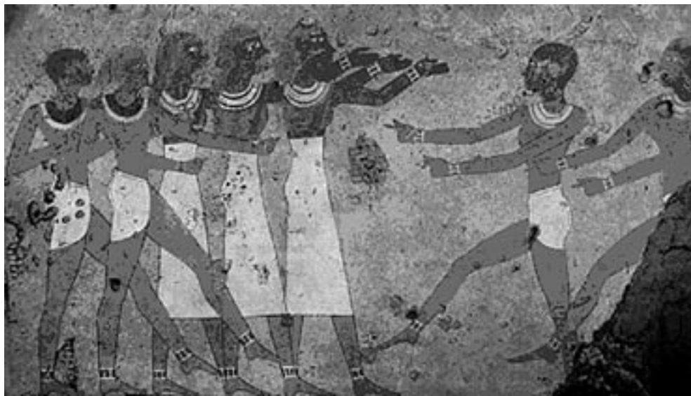
3. sz. kép: Énekesnők és táncosnők. Falfestmény Antefoker sírjában, Thébában.

Ha azt mondtuk, 63 hogy a tánc az emberi lélek önkifejeződése, akkor 64 Egyiptomban a tánc imádságos lelki tartalmakat fejezett ki. Vagyis a mozdulat révén imádkoztak . Úgy, 65 mint 66 ahogyan ma is léteznek 67 távol-keleti népek, 68 főként a maláji szigetcsoportokon, ahol 69 nemcsak szavakkal imádkozik a hívő, 70 hanem szimbolikus értelmű és tartalmú mozdulatokkal . 71 Az egyiptomi tánc a földöntúli étellel állt kapcsolatban és a valóságon túli dolgokkal élt bensőséges összefüggésben. A reliefek tanúsága szerint komoly, ünnepélyes, lassú sohasem végletes, ritmikus mozdulatoknak szerves összefüggése volt ez az imádkozó egyiptomi tánc. Később, az ú.n. Újbirodalomban, Krisztus előtt 1575-től lassankint 72 átalakul az egyiptomi tánc stílusa, lassan 73 elveszti ünnepélyesen vallásos tartalmát. Asszír, babiloni, föníciai, kisázsiai és hettita behatások révén az egyiptomi képzőművészet stílusváltozásaival párhuzamosan az egyiptomi tánc is megváltozik, komoly, lassú, patetikus jellegét levetve és fokozatosan 74 öncélú szórakoztatássá válik. Azok a leírások, amelyeket Hérodotosznál, Sztrabónnál és Diodórosznál olvashatunk, már erről a stílusváltozásról tudósítanak. 75 A kultusztánc mellett, sőt annak a rovására a magánházak ünnepélyein találkozunk a sokkal gyorsabb ütemű, szeszélyesebb ritmusú „modernebb” jellegű, a művészi mozdulatokban rejlő szépség esztétikai erejével szórakoztató táncokkal.