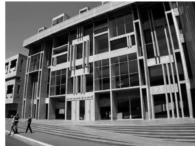
A Centre National de la Danse díjnyertes épülete Pantin-ben