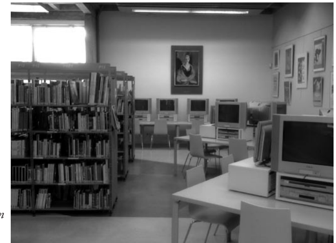
Olasóterem a Médiatárban