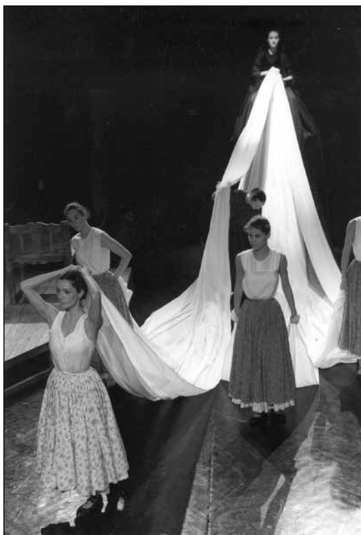
Foltin Jolán Harangok című koreográfiája

Amikor az irodalom és a táncművészet kapcsolatát vizsgáljuk szinte lehetetlen, hogy ne szenteljünk figyelmet a 20. század egyik legjelentősebb költőjének a táncsal való kapcsolatára. Federico Garcia Lorca életművében szinte minden gondolat, mondat mögött ott érezzük azokat az elemi erőket amelyekből a tánc megszülethetett. Lüktető táncritmusok feszülnek a drámákban, versekben, tanulmányokban. Ha lehetőségem lenne rá, szívem szerint minden táncossal – előadóművésszel és alkotóval egyaránt –, elolvasatnám Lorca: A „duende” (Játék és elmélet) című, 1930-ban írott tanulmányát. A megfoghatatlan titokról szól, arról ami nem tanulható és nem tanítható.