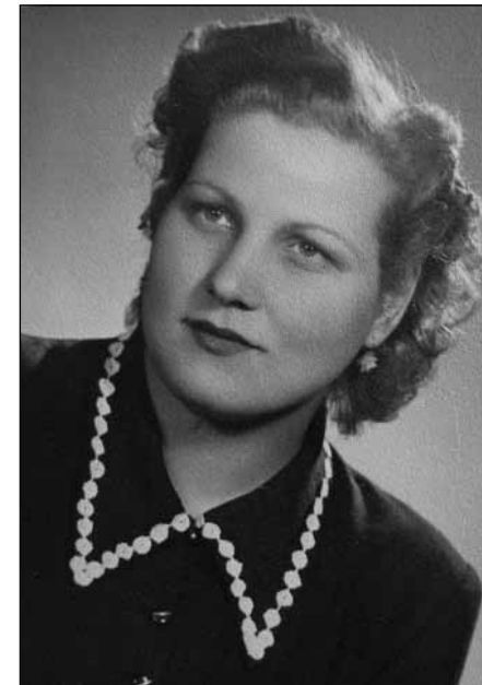
Kaposi Edit arcképe (Táncarchívum gyűjteménye)

A tanulmány Kaposi Edit (1923 – 2006) munkásságát szeretné bemutatni. Nagy figyelmet érdemel a törekvése, hogy a táncművészet tudományos alapokra helyezze, kiemelt szerepet szánva a Vályi Rózsa és a Táncarchívumban fellelhető tudományos munkáira, hagyatékára. Kaposi Edit életéről kevés fellelhető forrás áll rendelkezésre, de annál beszédesebbek az általa életre keltett Tánc-tudományi Tanulmányok szaktudományi lapban megjelent írásai-tanulmányai, a táncművészet tudományos aspektusból bemutató írásai, könyvfejezetei, tanulmányai. Fáradhatatlanul egy életen át azon munkálkodott, hogy a táncművészet tudományos szinten is elismertesse, és a magyar tánc hagyományokat (különös tekintettel a néptáncot) minden társadalmi réteg számára vonzóvá tegye, népszerűsítse hangsúlyozva a magyarországi táncművészet értékteremtő erejét.