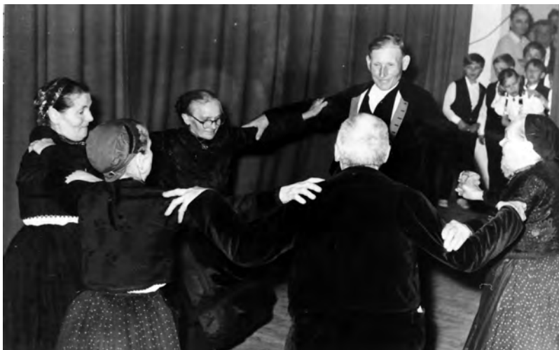
5. ábra. „Öregek”. Pontos évmeghatározás nélkül, c.a. 1970, Hajós.

A jegyzőkönyv harmadik oldalán a névlistában az alábbi táncosok neve tévesen került rögzítésre. Ezen kívül a filmfelvétel végén jól látszik, hogy nem tíz, hanem tizenegy táncos és három zenész volt jelen. Hiányzik egy női táncos, akinek személyét már nem tudták az adatközlők sem beazonosítani, illetve a fellelhető többi dokumentumból sem derült ki. Először közlöm a téves, majd helyesen az adatközlőim által javított nevet.