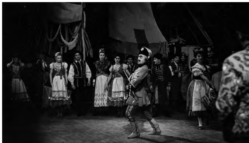
Jelenetkép: Lúdas Matyi. Harangozó Gyula. Erkel Színház, Budapest, 1964. 05. 26.

– Koreográfiát nem csinállok...Ha koreográfiai műveket készítek elő, akkor csak a saját elképzeléseim szerint tudok dolgozni. Nem tudok más szemével nézni...Pedig lenne mondanivalóm. Egyelőre azonban azon gondolkodom, hogy mi jót és szépet lehetne kitalálni a Vidám Színházban. 2