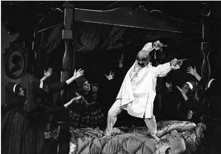
Jelenetkép: Lúdas Matyi. Harangozó Gyula. Erkel Színház, Budapest, 1960. 05. 02.

– Életem nagy álma – mondja – a magyar nemzeti balett továbbfejlesztése. Ez volt a célom akkor is, amikor Végvári vitézek címmel a török hódoltság korában játszó balettszövegkönyvet írtam. Zenéjét Ránki György komponálja. A balett, számomra, a legsokfélebb és legizgalmasabb művészet. 4