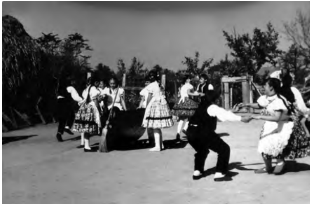
2. ábra Tánc jelenet a Fiedler - ház udvarán. Hajós, 1970.

terepmunka egy hirtelen történt haláleset miatt félig tudott csak megvalósulni. A tervek szerint 1970. október 10-én a kutatócsoportnak lehetősége lett volna egy sváb lakodalomban részt venni és filmezni, október 11-én pedig a település táncosai kerültek volna rögzítésre: „Amikor megérkeztünk, mint derült égből a villámcsapás, úgy tájékoztattak bennünket, hogy az esküvőre sor kerül, de a családban hirtelen bekövetkezett gyász eset miatt csak a legszűkebb körben kerül rá sor, és hogy ez a szomorú esemény valószínűleg a hangulatra is nyomasztóan hat majd. Valóban így is történt. Tekintettel arra, hogy egy fiatal, 42 éves férfi távozott az élők sorából, ez mély együttérzést váltott ki a helyi lakosság körében. Amíg a temetés nem történt meg, nem tudtunk munkához látni. Sokáig emlékezni fogunk a sok fekete bársonyba és fekete selyembe öltözött emberre, a hajósiakra, akik a temetőbe vezető végtelenül hosszú úton – az ókori tragédiák kórusaira emlékeztetve – rótták le kegyeletüket az elhunyt férfi előtt.” 28