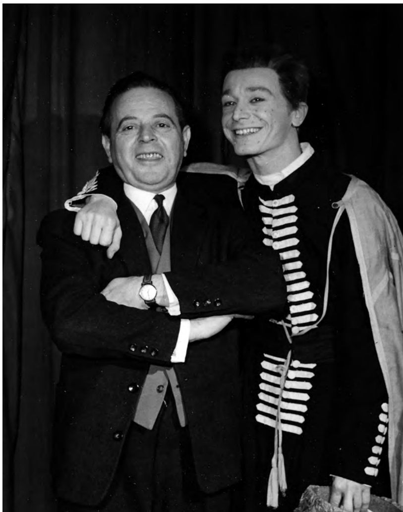
Furfangos diákok. Harangozó Gyula (civilben), Sípeki Levente (jelmezen). Magyar Állami Operaház, Budapest, 1965. 01. 28. (leltári szám: 001840,)