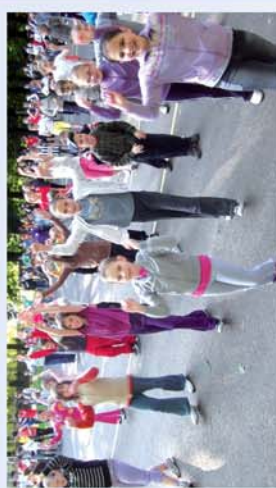
■ Kihívás Napja Csepregen