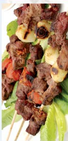
■ A nyár slágere: grillezés