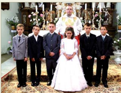
Köszönjük áldásos közreműködését!