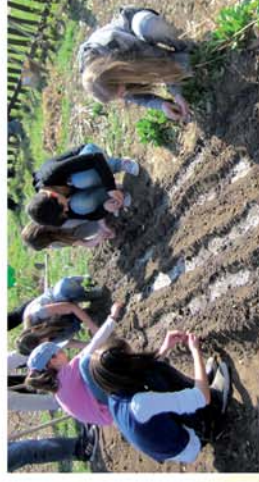
■ Vesa bele magad! 9. oldal