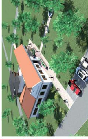
■ Bükki Polgármesteri Hivatal 5. oldal