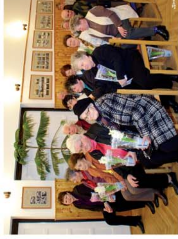
■ Közmeghallgatás Nagygyeresden 3. oldal

Kellemes húsvéti ünnepet kívánunk minden olvasónknak!