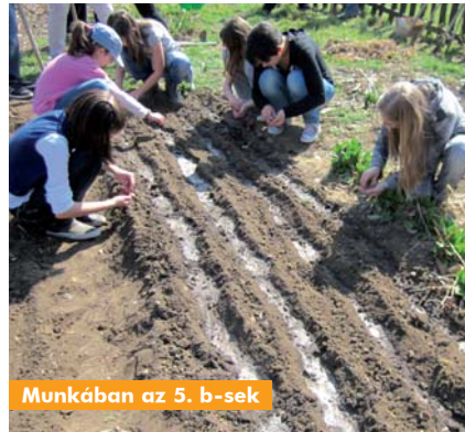
Munkában az 5. b-sek