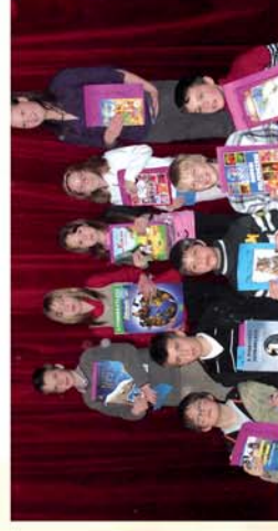
■ Színpadra fel! 12. oldal