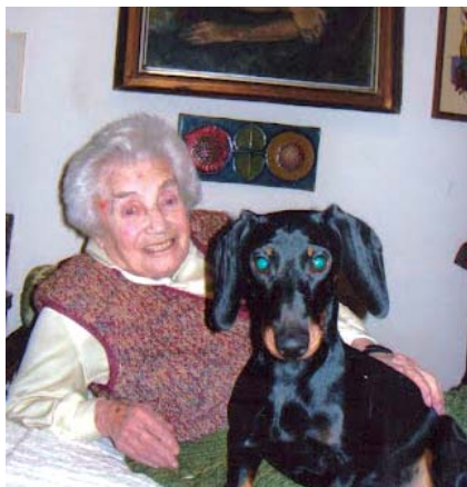
Radnóti Miklós özvegye

A büki iskola egy nyolcadikos tanulóból álló diákcsoportja két magyar szakos tanárno vezetésével két napon keresztül járta Budapest múzeumait, irodalmi emlékhelyeit.