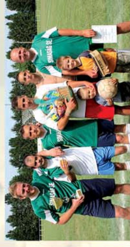
■ Bajnok a Reál