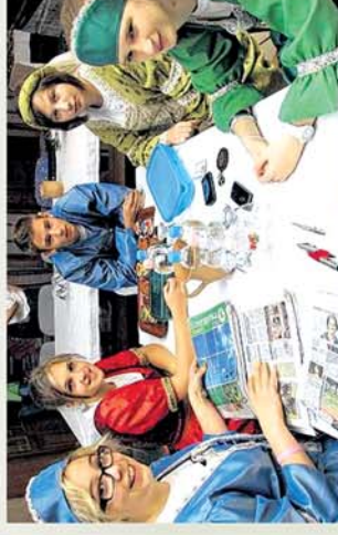
■ LADIK-kaik Bikaig