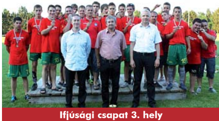
Ifjúsági csapat 3. hely

A sikerek talán abban a változásban keresendő, ami tavaly nyáron indult el egy új edzői kör egy új csapat létrehozásával. Elkészült a Csepregi Sportegyesület hosszú távú sportkonceptiója, amit véleményezett a város vezetősége és az MLSZ Vas Megyei Igazgatósága, s melynek célja egy olyan stratégia véghezvitele, mely az elkövetkező években kiváló eredményekhez jutatta a Csepregi Sportot. Az első nagy előrelépés megtörtént, hisz az intézményi fejlesztési pályázat benyújtása mellett, a felszerelések bővítése, s kisebb felújítások is elkészültek, s több korosztályban is ütőképes csapa-