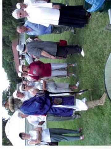
■ Aranyhíd Fesztivál – Révfülöp