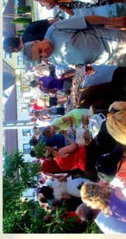
■ Falutúzás Egyházastalu