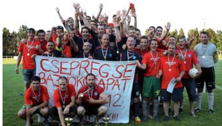
Felnőtt csapat 1. hely

erősítése érdekében a csapatépítő programokra, edzőtáborokra. Fontos a „Rügd a bőrt” nyári focitábor mely az idei évben 2. alkalommal kerül megrendezésre a Szébb Holnapért Egyesület összefogásával. A tábor ingyenes augusztus 13-19 között vár minden focizni vágyó gyermeket, Csepregen a Malomkeriben. Mindez a pályázati lehetőségek aktív kihasználása és a