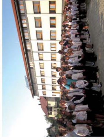
■ „De nehéz az iskolatáska...” 2. oldal