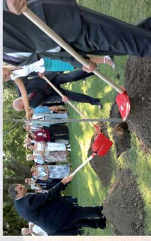
■ 50 éves a Büki Gyógyfürdő 8. oldal