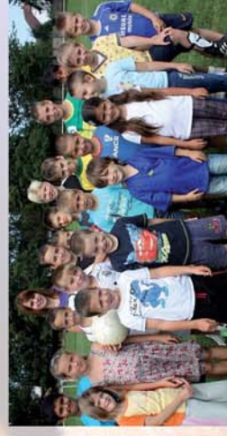
■ „Nyuziák” a bőrt rendezesi! 15. oldal