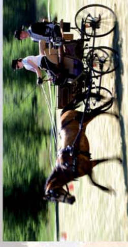
■ IV. Nagyerecsi Kettesfogathajó Verseny 11. oldal