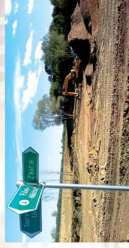
■ Út és fő épül Zsírán