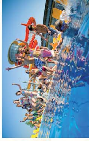
■ Locsmánd, a családi élményparadicsom 9. oldal