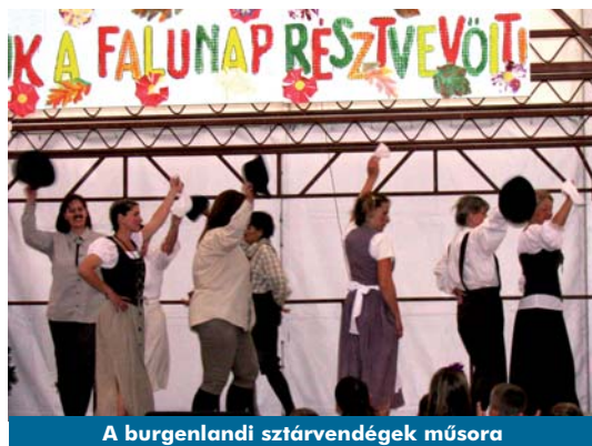
A burgenlandi sztárvendégek műsora