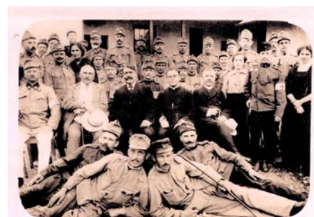
Ezen az archiv fotón az I. világháborús sebesültek körében látható, akiket a kiegészítő kórházban gyógyított.

hadifogolytábor betegeit is. Buzgó és eredményes működéséért a Vöröskereszt II. oszt. hadi-ékképményes díszjelvényével tüntették ki. Mint képesített fiziológus orvos, nagy szolgálatokat tett a közegészségügynek. Tagja volt Sopron vármegye törvényhatósági bizottságának. A két szomszédos nagyközségben, Bükön és Csepregben is, – ez utóbbiban 300 magyar holdas birtoka és majorja volt, melyet az egykori bükki cukorgyári gazdaságtól vásárolt – mint a képviselőtestület tagja, szolgálta a közérdeket, és annak keretében több újítást kezdeményezett. 1916-1933. között a Bükki Evangélikus Gyülekezet felügyelői tisztségét is betöltötte. 1937-ben hunyt el. Hivatásának élő, kitűnő orvos volt, aki a nagyközség határára kívül is megbecsülésnek örvendett.