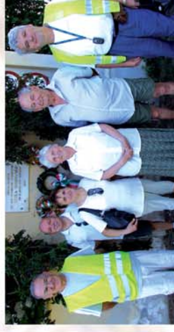
■ Kerekpártúra Fülesen