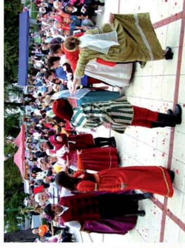
■ Csepreg feszt