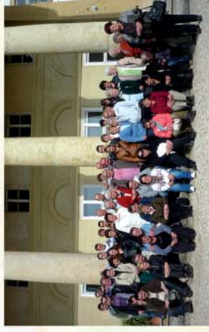
■ Falukirándulás Nagygeresden 11. oldal