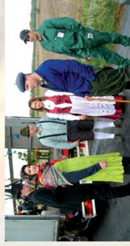
■ Szüreti kavalkád 15. oldal