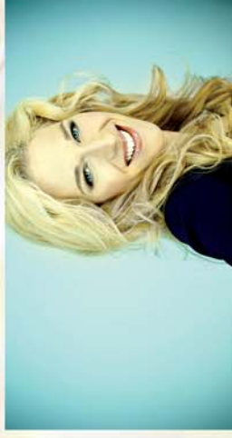
■ A kis Vuk magyar hangja... 14. oldal