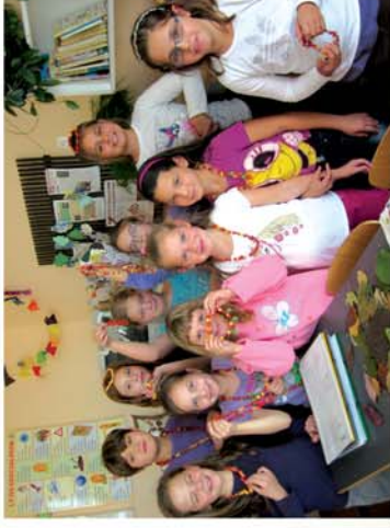
■ Őszi kavalkád a büki iskolában 5. oldal