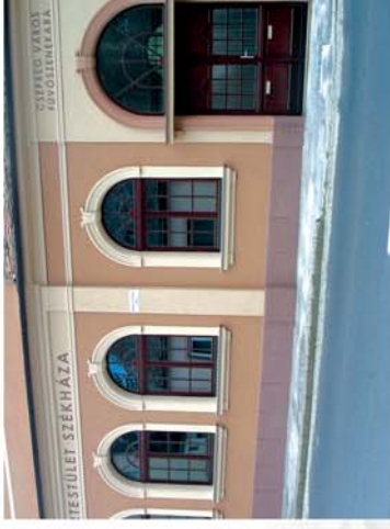
■ Centriumi tabló készül az iparosokról 4. oldal