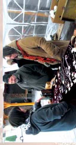
■ Karácsonyi Vásár 15. oldal