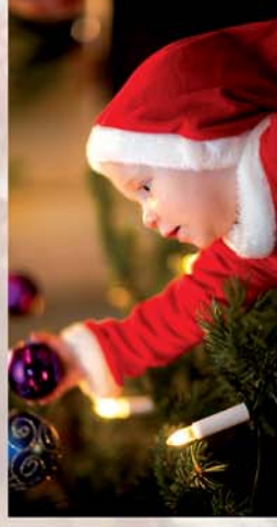
■ Adventi programajánló 13. oldal