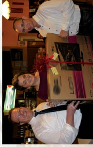
■ Bál a templom javára 10. oldal