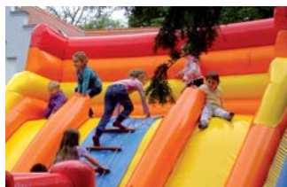
Gyereknapon örültek a gyerekek a trambulinnak és a csúszdának is!

mogatást kapnak az önkormányzattól havonta. Az iskolakezdés segítésére 400.000 forintot osztottunk ki. Az ivóvíz minőségjavítási pályázat folyamatban van. 5.400.000 forintot nyertünk rá első körben. A közmunka programban 6 fő vett részt, összesen 17 hónapot dolgoztak. Szeptember 15-én újra kinyitottuk az ifjúsági klubot. A többcélú társulás megszűnt. Önkormányzati társulás lett helyette, amelyben Tormásliget az orvosi ügyelethez és a belsőellenőrzéshez csatlakozott.