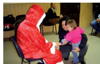
A program zárásaként megérkezett a Mikulás, aki először a bátor versmondókat, éneklőket, majd minden 14 év alatti gyermeket megajándékozott