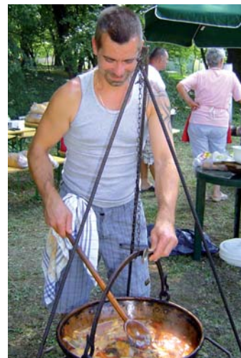
A főzőverseny után a zsűri úgy döntött, hogy nem hirdert nyertest, mert valójában a település nyert azzal, hogy együtt voltunk, és mindenki jól érezte magát

mogatást kapnak az önkormányzattól havonta. Az iskolakezdés segítésére 400.000 forintot osztottunk ki. Az ivóvíz minőségjavítási pályázat folyamatban van. 5.400.000 forintot nyertünk rá első körben. A közmunka programban 6 fő vett részt, összesen 17 hónapot dolgoztak. Szeptember 15-én újra kinyitottuk az ifjúsági klubot. A többcélú társulás megszűnt. Önkormányzati társulás lett helyette, amelyben Tormásliget az orvosi ügyelethez és a belsőellenőrzéshez csatlakozott.