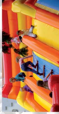
■ A 2012-es év „leltára” formásíjgeten