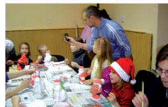
December 5-én összegyűlték a gyerekek a kultúrházban, közösen gipszszkulptúrákat festettek. Pingál 2 éves, 12 éves, sőt még felnőttek is bekapcsolódtak a kézműves foglalkozásba