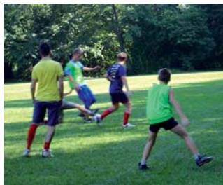
Volt futballmérkőzés, melyen négy helybeli csapat mérte össze erejét

Februárban farsangi mulatságot rendeztünk. Június 2-án gyereknap alkalmából, a gyerekek örülhettek az óriás csúszdának és az ugrálónak. Augusztus 18-án nyárbúcsúztató falu bulit rendeztünk, főzőversennyel egybekötve. Az önkormányzat támogatásával minden utcából egy csapat főzött, ezen kívül két csapat sült és főzött támogatás nélkül. Közben négy helyi csa-