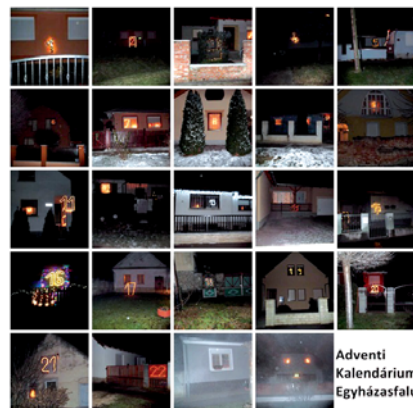
Adventi Kalendárium, Egyházásfalu