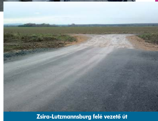
Zsira-Lutzmannsburg felé vezető út