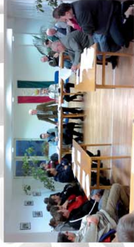
■ Közös önkormányzati hivatal Csepregen