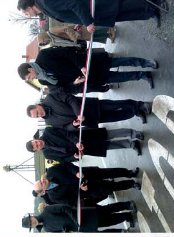
■ Két nappal a világvége előtt