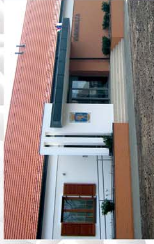
■ Városháza avatás Bükön