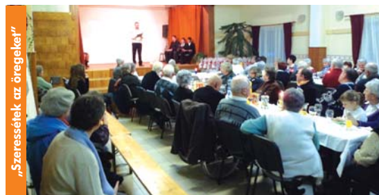
„Szeressétek az öregeket”

Ezután a rendezvény a hagyományoknak megfelelően folytatódott az óvodások, iskolások és felnőttek műsorával, illetve egy vidám