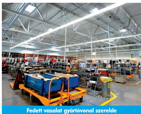
Fedett vasalat gyártóvonal szerelde

Elkészült a Roto Elzett Certa Kft. két új csarnoka Lövőn a közel 3 milliárd forintos (10,5 millió eurós) beruházás keretében.