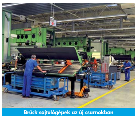
Brück sajtológépek az új csarnokban