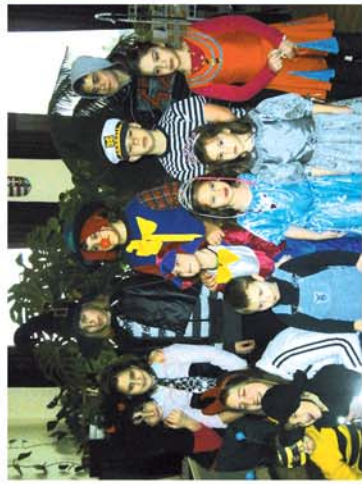
■ Farsangi multság Nemesládonyban 3. oldal