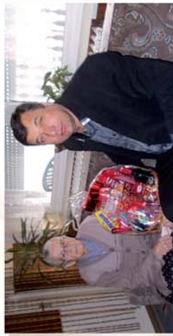
■ 90 éveseket köszöntöttünk! 10. oldal