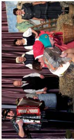
■ Szólt a nóra, szállt a dal 6. oldal