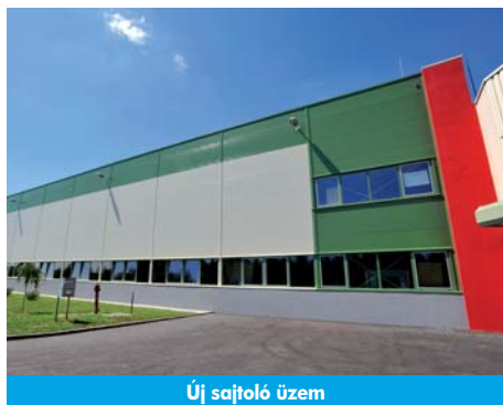
Új sajtoló üzem