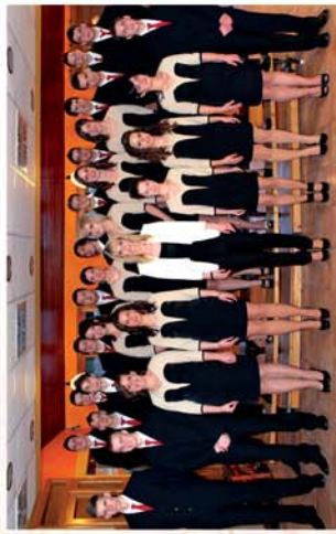
■ „A csend beszél tovább...” 5. oldal