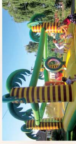
■ Lócs ünnepe