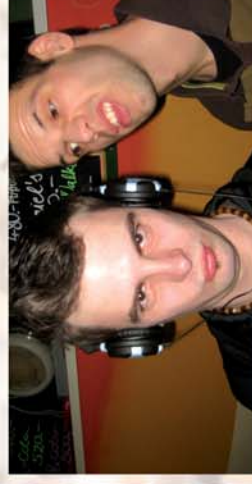
■ DUBFORMATION DJ's