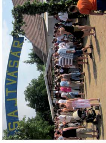
■ Sajtoskál sajtos ünnepén

Naponta friss hírek a www.repcevidek.hu weboldalon!