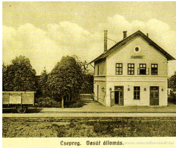
Csepreg. Vasút állomás. www.vasutallomasok.hu

a többi dunántúli HÉV építésében is fontos szerepet játszott. Az előmunkálatok 1912 júniusában indultak. A földmunkák végzésére alföldi kubikusokat szerződötetett az építésvezetőség. Ők november végéig, majd 1913 tavaszától dolgoztak az épülő vonalon. A magas építményeket olasz kőművesek készítették, mellettük helyi culágerek dolgoztak. Júliusban már anyagvonatok közlekedtek