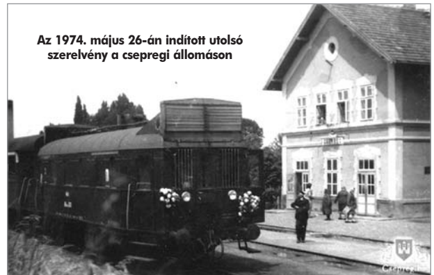
Az 1974. május 26-án indított utolsó szerelvény a csepregi állomáson

Az utolsó szerelvény 1974. május 26-án közlekedett. Egy évvel később a vágányokat is felszed-