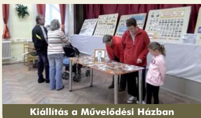
Kiállítás a Művelődési Házban

már 8 éve, 2005-ben megszűnt simasági iskola. A kiállításon sok egykoron Simaságon tanuló diák megjelent, nosztalgiával idézve fel a múltbéli szép emlékeket.