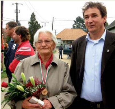
Polgármester úr Ica néniével

Iskolai tablóképekből nyílt kiállítás a Művelődési Házban. Az eseményt az tette aktuális- sá, hogy jövőre lenne negyven éves, az im-