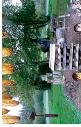
■ „Itt van az ősz, itt van újra...”

Naponta friss híreket www.repcevidek.hu weboldalon!