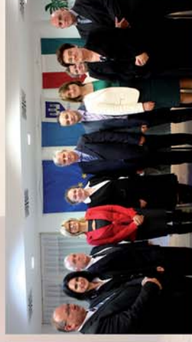
■ Önkormányzati alakuló ülés Csepregen