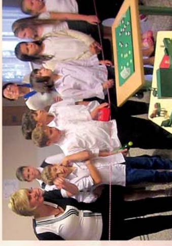
■ Így emlékeztünk mi