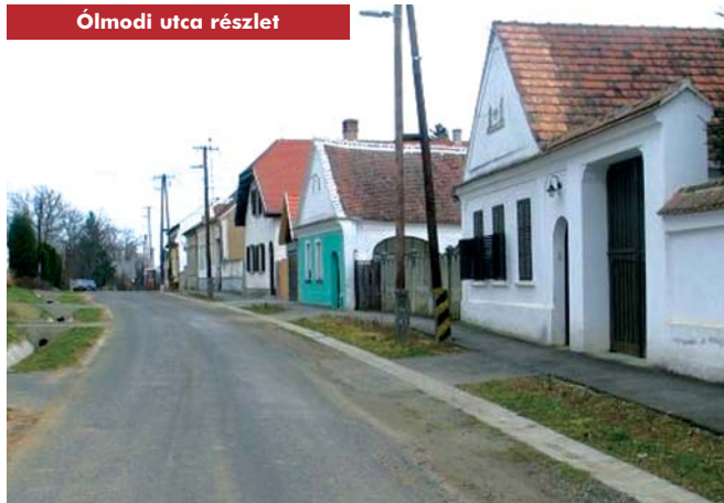
Ólmodi utca részlet

mellett voksoló három település nem érdemelné meg a hűség falva címet?) Locsmánd [ma Lutzmannsburg], Rőtfalva [ma Rattersdorf], Rendek [ma Liebing] és más települések osztrák nemzeti érdeletről tettek tanúbizonyságot. A határmegállapító bizottság 18 község visszacsatolását javasolta Magyarországhoz. A Népszövetség Tanácsa (az ENSZ elődje) 1922. szeptember 19-én tíz Ausztriához csatolt település: Rőtfalva, Rendek, Kis- és Nagynarda, Alsó- és Felsőcsatár, Magyar- és Németkeresztes, Pornóapáti és Németlövő Magyarországhoz történő visszatéréséről és Lovászat [ma Lusing] falu Ausztriához történő csatolásáról döntött. Köpcseny [ma Kiftsee], Németjártalu [ma Deutsch Jahndorf], Ólmodot, Hámortót [ma Hammerteich], Lékát [ma Lockenhaus], Csém [ma Schandorf], Csajtát [ma Schachendorf] és Szentpéterfát meghagyták Ausztriában.