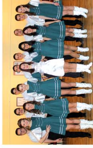
■ Báloztak az egyházközség tagjai

Naponta friss hírek a www.repcevidek.hu weboldalon!