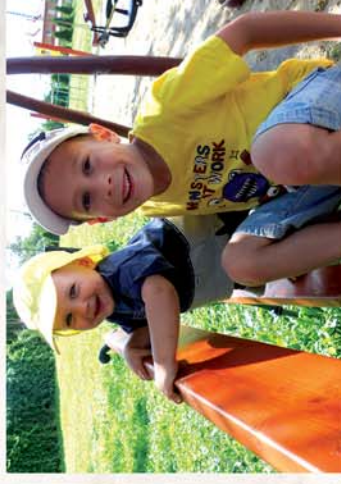
■ Mert örökre fogadni jó!