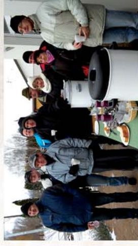
■ Szilveszteri bortúra