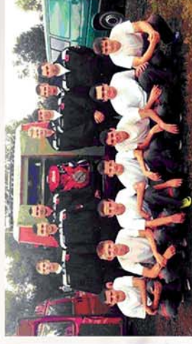
■ Egy mozgalmas tűzoltó év