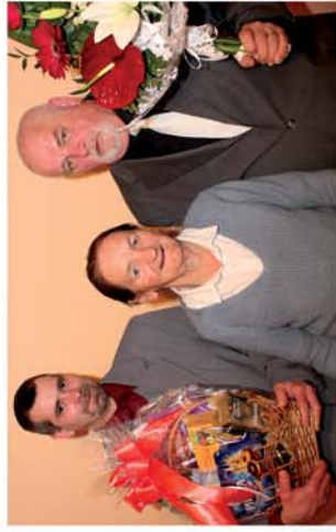
■ Szépkorú köszöntése Tormásligeten 2. oldal

Naponta friss hírek a www.repcevidek.hu weboldalon!