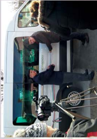
■ Új közösségi busz Iklanberényben 12. oldal