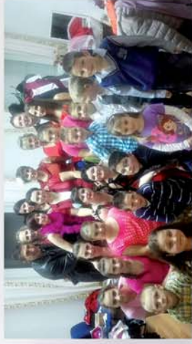
■ Tompaládonyi tavaszváró 6. oldal