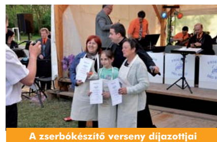
A zserbókészítő verseny díjazottjai

A továbbiakban a felújítással kapcsolatban őt kérdeztük. – A salamonfai Szent László templom felújítását az orgona belsejének rendbetételéhez adott nagyobb összegű adomány indította el. Ezt követően a szentélyben és a sekrestyében szükséges vakolatjavítás, majd a teljes templombelső átfestésére került sor. Ezzel párhuzamosan a sekres-