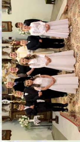
■ Elsődíjazás Zsírán