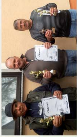
■ Horgászverseny Sajtóskálán