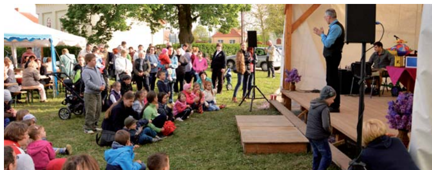
A bűvész és közönsége

tyébe és a bejárathoz új járólapok kerültek. Ki kell emelni, hogy mindezen munkák, a helyi mesteremberek társadalmi munkájának felajánlásából valósultak meg. A templom ékességei is megújultak: a Szent Józsefet a kis Jézussal ábrázoló oltárkép, a fából készült szobrok, a templom falát díszítő nagykereszt, valamint a tabernákulum is restaurálásra került a helybeliek nagylelkű felajánlásából. Új kóruslépcső is készült egy beépített szekrénnyel együtt, mely a padokhoz és a kórus mellvédjéhez hasonlóan egységes festést kapott. A belső munkálatok láttán felmerült, hogy az épület külső része – mivel még nincs rossz állapotban – minimális kőműves munka után kapjon egy frissítő festést, mely el is készült. Ezt a plébánia önerő-