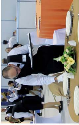
■ Az ország egyik legjobb pincére

Naponta friss hírek a www.repcevidek.hu weboldalon!