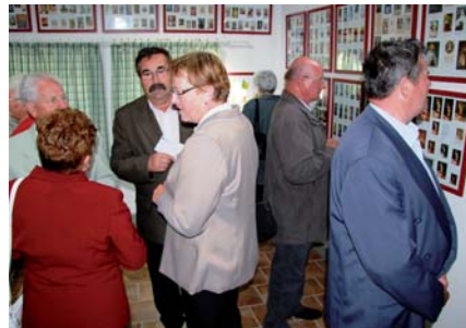
Fotó: Sulics Boglárka • További képek a www.repcevidek.hu weboldalon

A megnyitót megtisztelte jelenlétével Ágh Péter, országgyűlési képviselő is. Beszédében hangsúlyozta az összefogás jelentőségét. Hiszen ez a kiállítás sem jöhetett volna létre összefogás nélkül. Bár Iklanberény nem kegyhely, mégis remélhetőleg sokan viszik hírül e csodálatos kiállítást. A gyűjtemény szombatoként a szentmiséikkel egy időben illetve előre egyeztetett időben tekinthető meg. SB