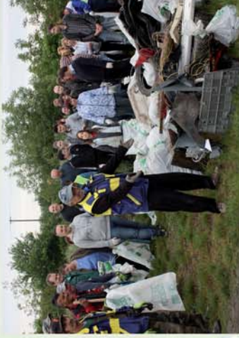
■ „Te Szecdi!” Csepregen