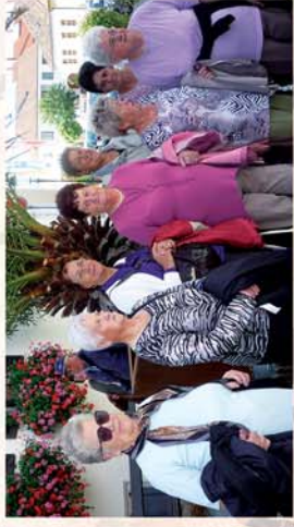
■ Rusi élményűt, csókkikóstolóval