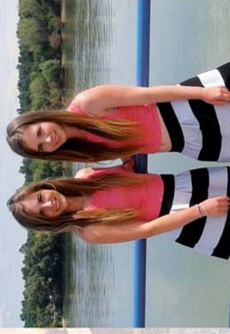
■ Országos Ikerfalalkozó