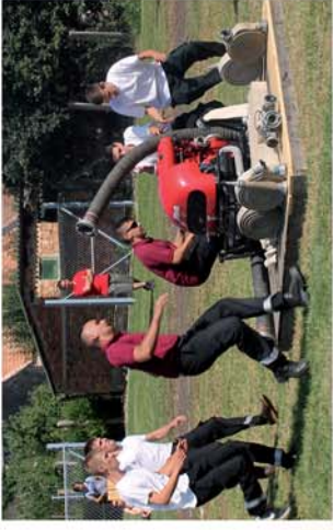
■ 37. Tűzoltó Répce Kupa