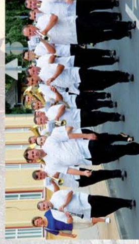
■ Csepreg Fesztivál 2015