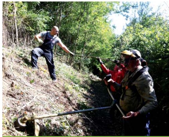
Csokonai utca - Fehér utcai övárók tisztítás

mentesítése, annak érdekében, hogy az utcából a csapadékvíz megfelelő módon elvezetésre kerülhessen. A tisztítás és karbantartás magában foglalja az árkok területén lévő bozotosok, fás szakaszok kiirtását.