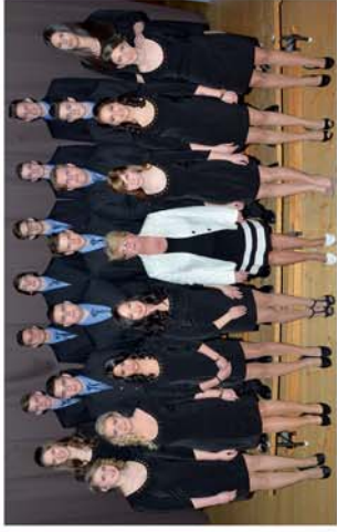
■ Csak álom volt a szép diákvilág? 2. oldal