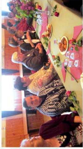
■ Édesanyám köszöntelek, most, e meghitt ünnepen 4. oldal