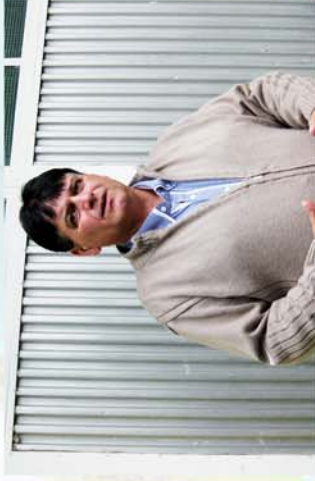
■ Tető és új falubusz is jó lenne 6. oldal