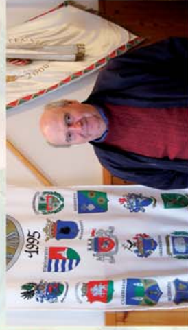
■ Virágos tervek Iktanbányában 8. oldal