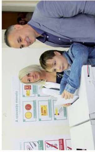
■ Választottak a csepregek