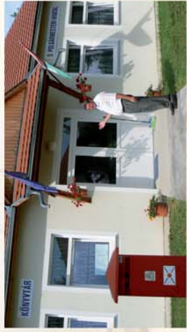
■ Tervek és jelen Lócson