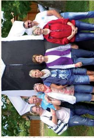
■ Megint összejöttek a Berényiek