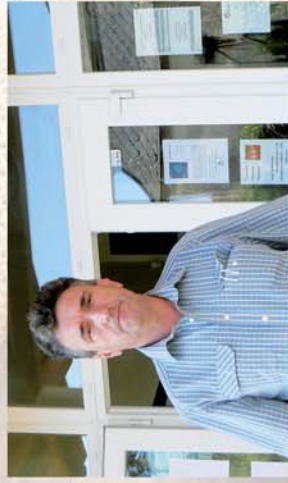
■ Felújítanak az óvodát Peresznyén