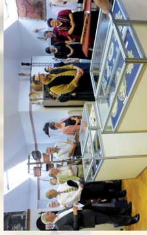
■ Jubileumi kiállítás Bükön