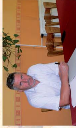
■ Patak-tervek Répcevisen