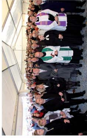
■ Közös emlékezés