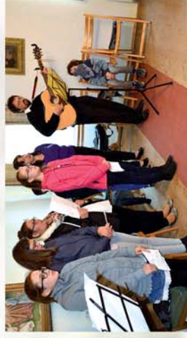
■ Nyitottság és hála: gyülekezeti nap Szakonyban