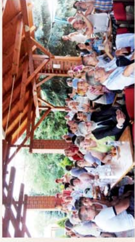
■ Az ünnep a közösség