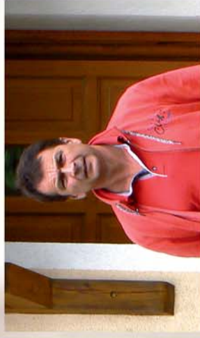
■ Mint egy mediterrán ékkő - Tömörd