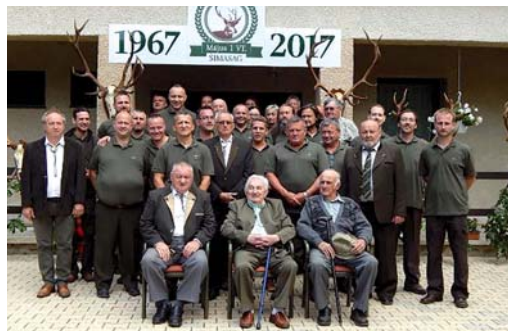
A Vadásztársaság tagjai és a három alapító tag

dásztársaság, 3068 hektáron gyakorolja a vadászati jogot. Az eddigi elejtésre került legnagyobb őzbak trófeája 520 grammot nyomott, 1980-ban került puszkavégre, mely pár évig megyei rekord volt. A gímszarvas trófea terület rekordja 11,10 kg-os volt, melynek viselőjét