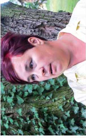
■ Répceszentgyörgyi választás