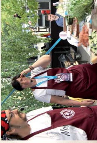
■ Büki Gyógy-Bor Napok