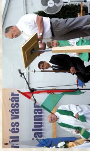
■ Falunap és Sajt vásár Sajtoskálán