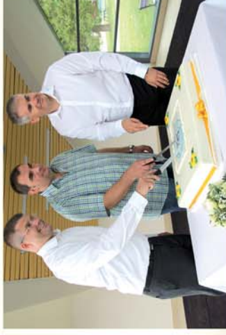
■ Születésnapos fürdő