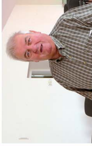
■ Ahol megbecsülik az időseket

Naponta friss hírek a www.repcevidek.hu weboldalon!