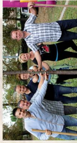
■ Egy nap, amely csak a családokról szól