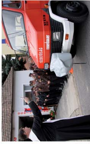
■ 130 éves lánglovagok

Naponta friss hírek a www.repcevidek.hu weboldalon!