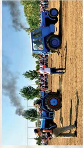
■ Másodszor volt traktoros nap Sopronhorpácson