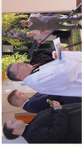
■ Megújult a formásigeti ravatalozó