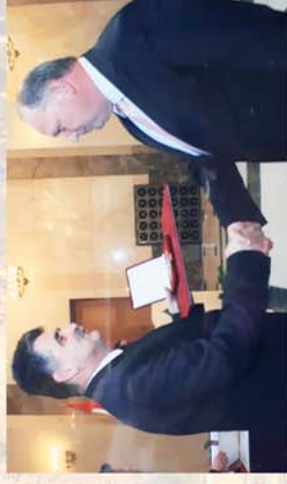
■ Önkormányzatokért Miniszteri Díj