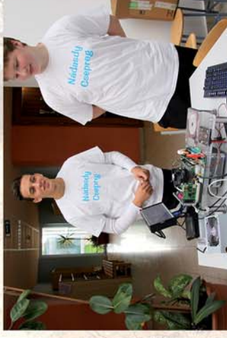
■ Pályorientációs nap Csepregen