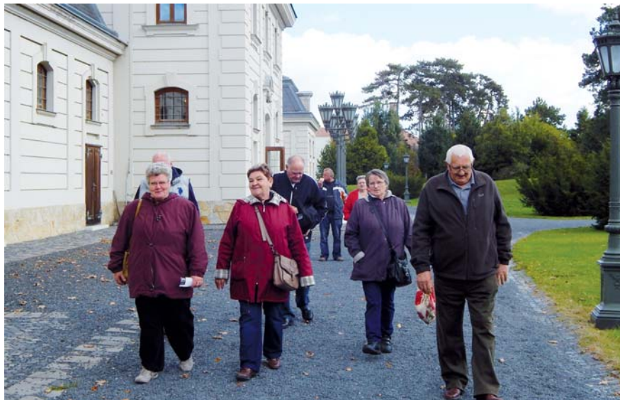
A kastélyból sétálunk a múzeumba

tött vacsorán vettek részt a kirándulók. A vacsora kemencében sült húsos finomságokból állt, a kulináris élvezetek után – és közben – a kóstolt bo-