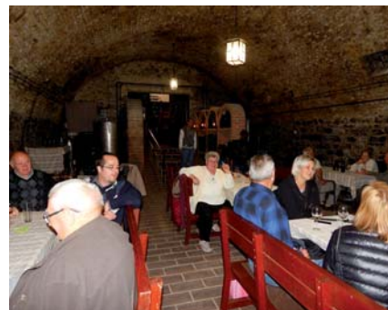
Szent Antal pincészetben jó a hangulat

Ezután egyórás szabadprogram következett, amelyet ki-ki saját igénye szerint használt fel. Volt, aki Keszthely főutcáján tett egy nagy sétát, mások a Magyarok Nagyasszonya-plébániatemplomot látogatták meg, és voltak, akik egy-egy pizzériában vagy kávézóban múltatták az időt. Három óraker indult a busz Szigligetre, ahol a Szent Antal pincészetben borkóstolóval egybekö-