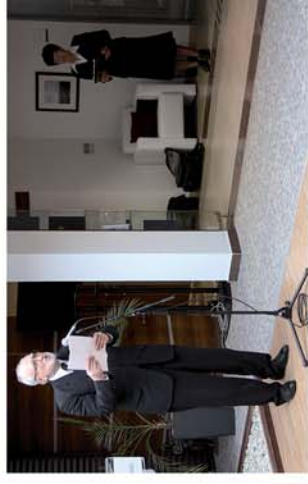
■ Új emlékművet avattak Bükön

Naponta friss hírek a www.repcevidek.hu weboldalon!