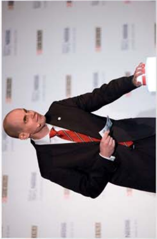
■ 20 milliárd forint értékben bővítette büki gyárát a Nestlé 8. oldal