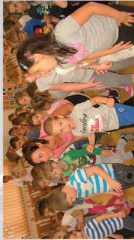
■ Mozdulj Velünk! 14. oldal