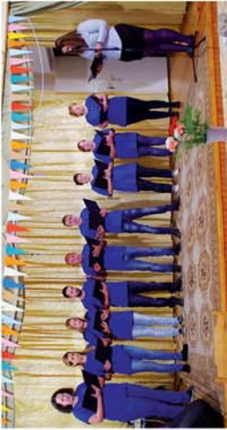
■ Nyugdíjas találkozó Nagygeresden 8. oldal

Naponta friss hírek a www.repcevidek.hu weboldalon!