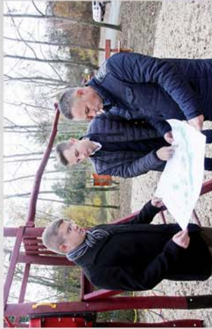
■ Akadálymentes horgászstég is lesz a Teglagyári-tónál 10. oldal