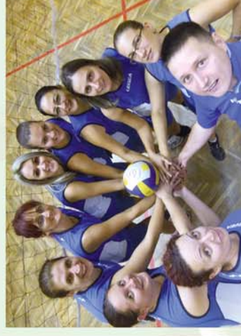
■ A sopronhorpácsi Tigrisek