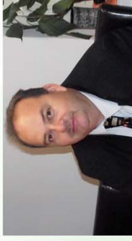
■ Horgászegyesület és járdafelújítás