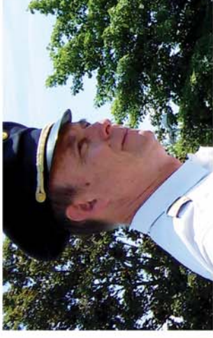
■ „Vitéz Both Béla Emlékdíj”