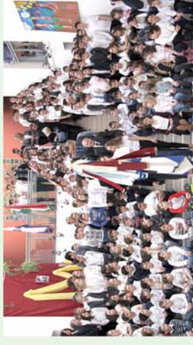
■ Alapítójukra emlékeztek a csepregi iskolások