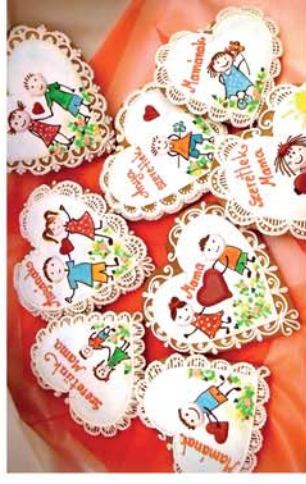
■ Szívából készül a mézeskalács

Naponta friss hírek a www.repcevidek.hu weboldalon!