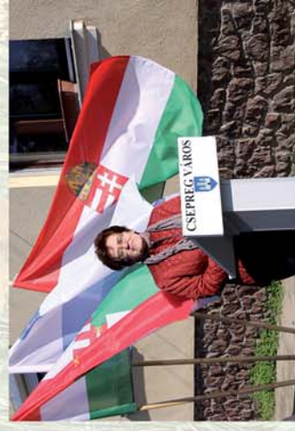
■ Felújították a Taksony és Taksony köz utcákat