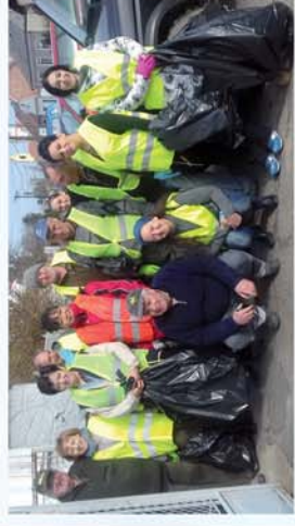
■ Személgyűjtés Szakonyban