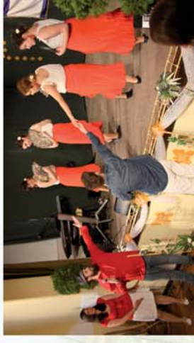
■ Visszük Csepreg jó híret