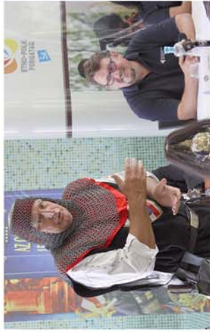
■ Királyi éltelk és királyi zenék!

Naponta friss hírek a www.repcevidek.hu weboldalon!