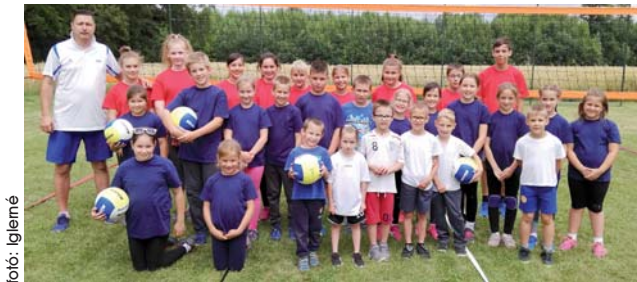
Mini, Manó és ovis röplabdacsapat

tásáról. Délután kettőkor kezdődtek a programok a futballpályán és az előző este felállított röplabdapályán.