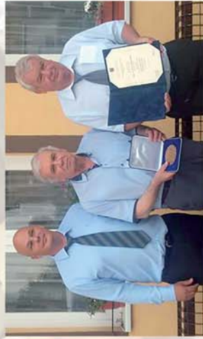
■ Megható búcsú a falu szeretett orvosától