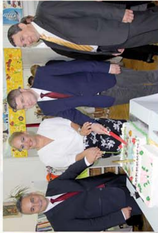
■ Az óvodai nevelés jubileuma Csepregen 10. oldal