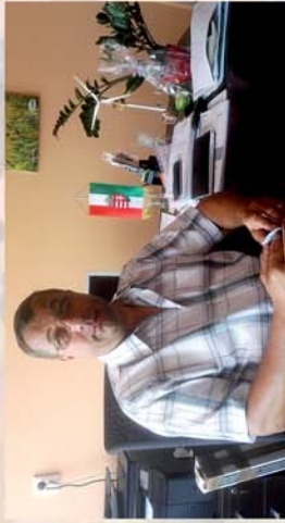
■ Kis lépésekkel haladunk előre