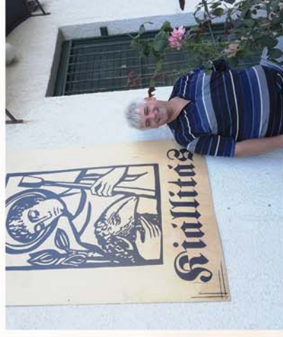
■ Megújult a ravatalozó Chernelházaudományán