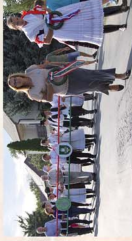
■ Sopronhorpácsi falunap képekben...