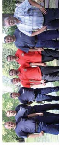
■ Peresznyei falunap képekben...

Naponta friss hírek a www.repcevidek.hu weboldalon!