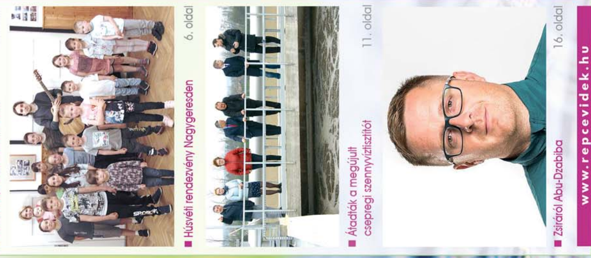
■ Kiszidány, a „beavatós” falu