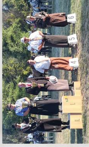
■ Rengeteg látogató, tartalmas programok 13. oldal