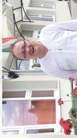
■ Ahol a lehetetlen is lehetséges...