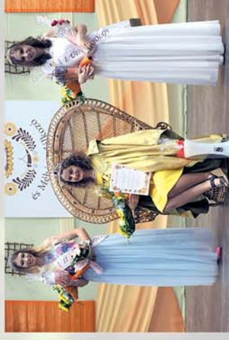
■ Mehkirálynőt választottak