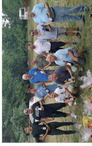
■ Csepregi Nemzetközi Lovverseny