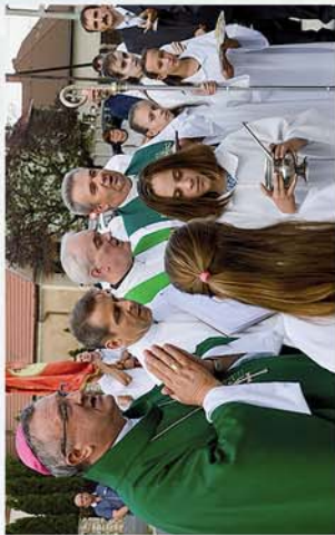
■ Áldás a felújított völcszeji kápolnán és szobrokon