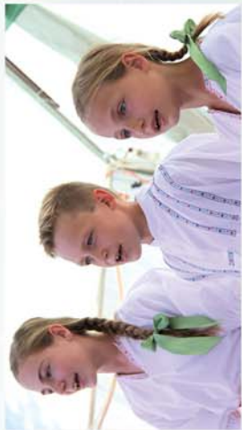
■ 3 napos falunap Ólmodon