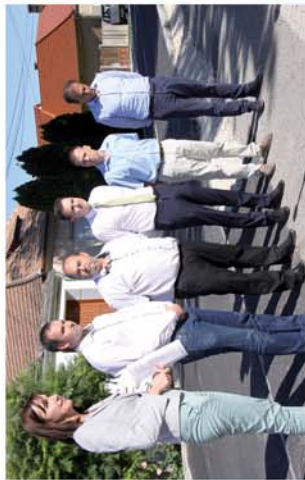
■ Elkészült az útfelújítás Zsirán