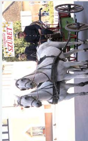
■ Csepreg szünet