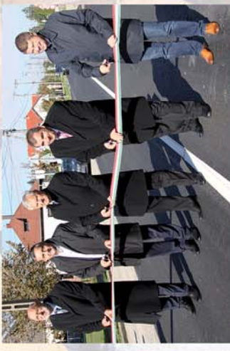
■ Elkészült, és át is adták 10. oldal