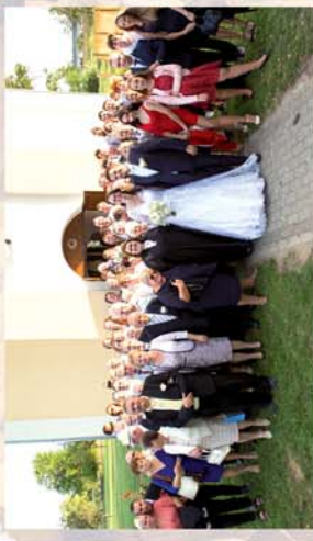
■ Igazi falusi esküvő Meszlenben 12. oldal