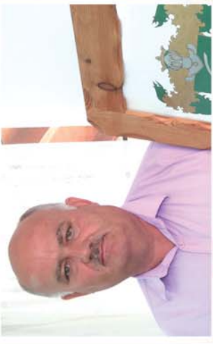
■ A régóta várt nagy lépés.. 4. oldal

Naponta friss hírek a www.repcevidek.hu weboldalon!