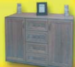
Kombinált 4 fiókos