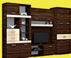
Corfu szekrényisor 243.800-Ft 142.500 Ft