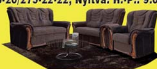
Hannover 3-2-1 349.900-Ft 299.900 Ft