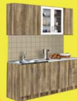
Kinga konyha 439.900-Ft 119.000 Ft