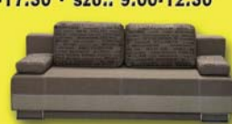
Cindy kanapé 444.600-Ft 96.400 Ft