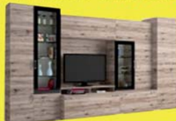
Messina szekrényisor 274.800-Ft 183.200 Ft