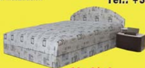
Akciós! rugós franciaágy 442.500-Ft 74.990 Ft