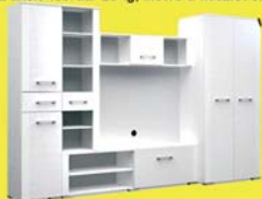
Baldo szekrényisor 243.800-Ft 142.500 Ft

Tel.: +36-20/275-22-22, Nyitva: H.-P.: 9.00-17.30 • szo.: 9.00-12.30