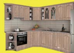
Kitti elemes konyha