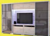
Bond TV-s gardrób 392.900-Ft 261.900 Ft