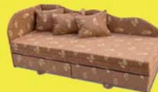
Dézi kanapé 85.800-Ft 57.200 Ft