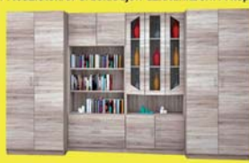
Viktória szekrényisor 449.900-Ft 118.400 Ft