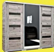
Capri 239 gardrób 224.900-Ft 147.900 Ft