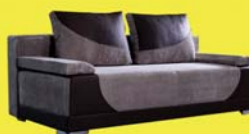
Paulina II. kanapé 474.900-Ft 114.600 Ft