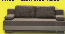
Cindy kanapé 444.600 Ft 96.400 Ft