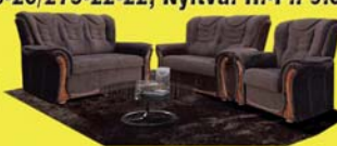
Hannover 3-2-1 349.900 Ft 299.900 Ft