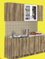
Kinga konyha 439.900 Ft 119.000 Ft