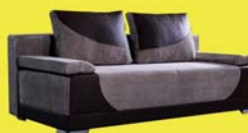
Paulina II. kanapé 471.900 Ft 114.600 Ft