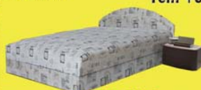
Akciós! rugós franciaágy 442.500 Ft 74.990 Ft