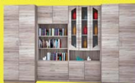
Viktória szekrényisor 449.900 Ft 118.400 Ft