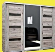
Capri 239 gardrób 221.900 Ft 147.900 Ft