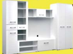
Baldo szekrényisor 243.800 Ft 142.500 Ft

Tel.: +36-20/275-22-22, Nyitva: H.-P.: 9.00-17.30 • szo.: 9.00-12.30