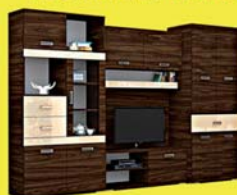
Corfu szekrényisor 243.800 Ft 142.500 Ft