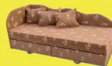
Dézi kanapé 85.900 Ft 57.200 Ft