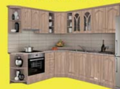
Kitti elemes konyha