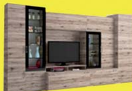
Messina szekrényisor 274.900 Ft 183.200 Ft