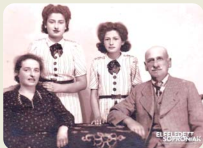
Szüleivel és hűgával 1942-ben.

https://sites.google.com/site/hirschlercsalad/csepregi-promenad-honlapon .