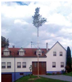
A malomházi jubileumi fa

Napjainkra a köztisztaság helyzete nálunk is lényegesen megváltozott. Az évenkénti szemégyűjtési akciók átmenetileg segítettek, de a nagy szemétkupacok megmaradtak. Először a büki önkormányzat szüntette meg radikálisan a lócsi út melletti illegális szeméttlerakót. Az idei év elején sor került a csepregi és részben a szakonyi határban levők elszállítására, s a legveszélyeztetettebb helyek mellé a lócsi útihoz hasonló napelemes kamerák elhelyezésére. Néhány településen – főleg a külterületen – akadnak még szemétkupacok, de a falvak zömében is általában sokkal rendezettebbek és tisztábbak az út menti területek, mint évtizedekkel ez előtt. Sokat köszönhetünk e téren az önkormányzatok hozzáállásának, a civil szervezeteknek, a település gondnokoknak, közmunkásoknak, de lassan változik a lakosság szemlélete is. Ma is akadnak település-