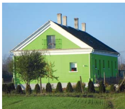
A felújított felsőgyári tisztai lakás ma Szakonyban, a Felsőgyári (népiesen: Fekete) úttól jobbra.

Az állandó munkások egy része a karbantartást is végző gépészből és iparosmesterekből (lakatos, kovács, rézműves, asztalos, bogsnár, szíjgyártó, kádár stb.), másik része a napszamosokat felügyelő előmunkásokból és cukorfőző mesterekből állt. A cukorfőző szakemberek – a többi Sopron megyei gyárhoz hasonlóan – németek és csehek voltak, akik féltékenyen őrizték tudományukat. A kampányt követő cukorfinomí-