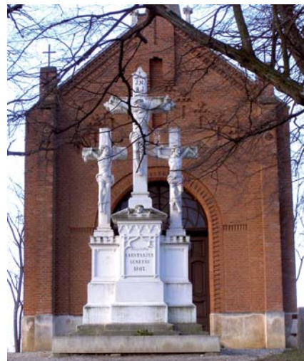
A csepregi Kálvária kőkeresztje